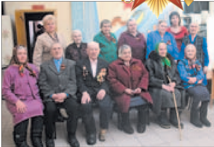
ФОТОГРАФИЯ НА ПАМЯТЬ: ВЕТЕРАНЫ ВОЙНЫ И ТРУДА СЕЛА СПАС-ВИТАЛИЙ