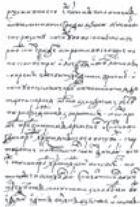
ПЕРВОЕ ПОСЛАНИЕ ИВАНА ГРОЗНОГО КУРБСКОМУ (СПИСОК АРХЕОГРАФИЧЕСКОЙ КОМИССИИ)

Вернувшись в Грецию, принял постриг в Афонском православном монастыре. В 1518 году по приглашению Василия III прибыл в Москву для перевода и исправления церковных книг. Занял заметное положение при дворе великого князя и в кругу русского духовенства, сблизился с боярской оппозицией, считавшей, что хотя высшая мирская власть от Бога, но должна действовать в согласии с духовенством и боярами. В своих произведениях обличал общественные порядки, клеймил пороки духовенства, поддерживал так называемых нестяжателей в их борьбе против