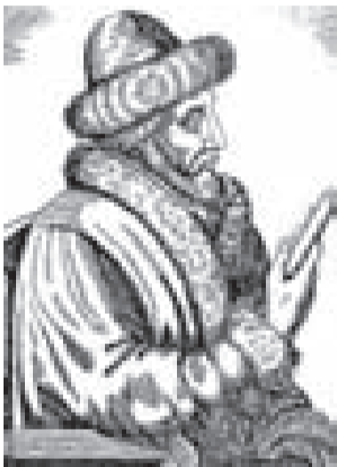
АНДРЕЙ КУРБСКИЙ, КНЯЗЬ КОВЕЛЬСКИЙ

монастырского землевладения. Публично выступил против развода Василия III с княгиней Соломонией из рода Сабуровых, считая это «неканоничным». Разгневанный князь и его бояре поспешили обвинить Максима в искажении священных текстов при переводах. Он был обвинен в ереси и осужден на специально созданных в 1525 и 1531 годах соборах за «преднамеренную порчу книг и действия, враждебные государству». Провёл многие тяжкие годы в заключении в разных монастырях, скончался в Троице-Сергиевом монастыре, причислен к лику святых в XVII веке.