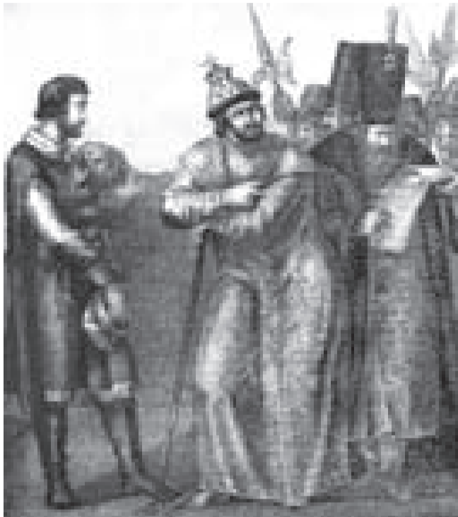
ИВАН ГРОЗНЫЙ ВЫСЛУШИВАЕТ ПИСЬМО ОТ АНДРЕЯ КУРБСКОГО (РИС. Б. ЧОРИКОВА, 1836)

Правительство Сильвестра и Алексея Адашева, созданное боярами при юном Иване IV, проводило политику в интересах боярства. В письмах к Ивану Грозному и в историческом памфлете «История о великом князе Московском», написанных уже после побега Курбского в Литву, князь Андрей также показал себя идеологом феодалного боярства, боровшегося за сохранение своих исключительных привилегий в деле управления государством. Между тем царь всё настойчивее проводил в жизнь меры, направленные на укрепление централизованного национального государства, на централизацию государственной власти. Боярство при этом неминуемо теряло привилегии и потому вся-