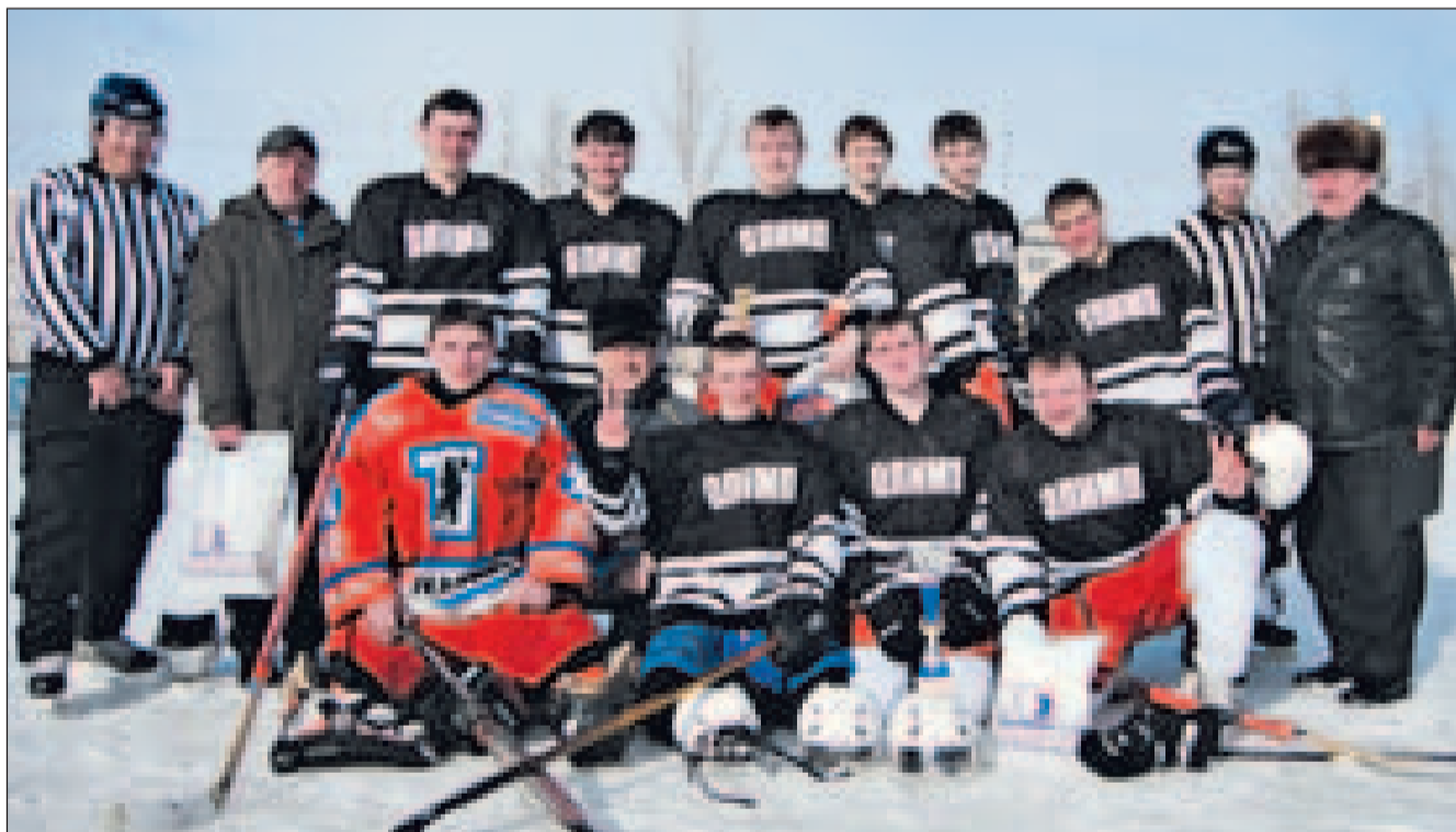
ХОККЕЙНАЯ ДРУЖИНА «ОЛИМП» ИЗ ТУНОШНЫ, ВЫИГРАВШАЯ ТУРНИР ПАМЯТИ СВОЕГО ЗЕМЛЯКА ГЕРОЯ РОССИИ А.А. СЕЛЕЗНЕВА