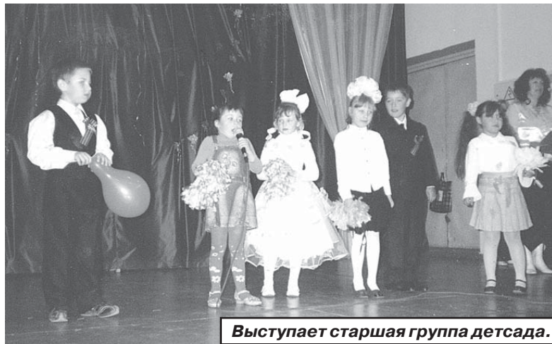
Выступает старшая группа детсада.