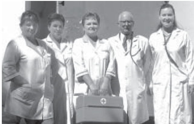
В 1958 году больницу перевели в Курбу, в здание бывшего райисполкома. Через 10 лет ей было передано старое здание Курбской средней школы. Вот в этих-то приспособленных помещениях трудится и по сей день медицинский персонал МУЗ Курбской участковой больницы.

В 1927 году здание сгорело. Тогда было решено построить больницу в с. Васильевское. Многие жители Курбы и окрестных деревень до сих пор помнят два деревянных одноэтажных здания. Одно занимала амбулатория и инфекционное отделение, в другом находились стационар и родильный дом. Год за годом расширялись возможности больницы. Увеличилась коечная сеть с 35 до 50 коек.