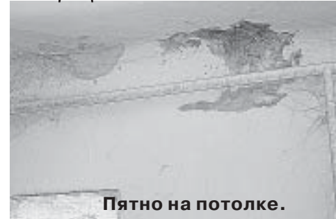
Пятно на потолке.