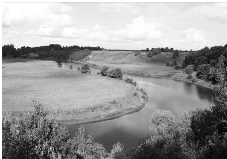
«Родные просторы». Автор – Екатерина Виноградова.

Но вот наконец долгожданный указатель населенного пункта, сообщающий, что наши мьгарства закончились. Доброжелательные хозяева вместе с домашними любимцами встречают у калитки. Какой здесь удивительный воздух, наполненный ароматом цветущей липы, свежескошенной травы, роз, лилий, флоксов и других растений, посаженных в цветнике перед домом! Пока мужчины разбирают вещи и совещаются об организации вечера, вместе с хозяйкой обхожу владения и слушаю ее незатейливый рассказ о местных достопримечательностях.