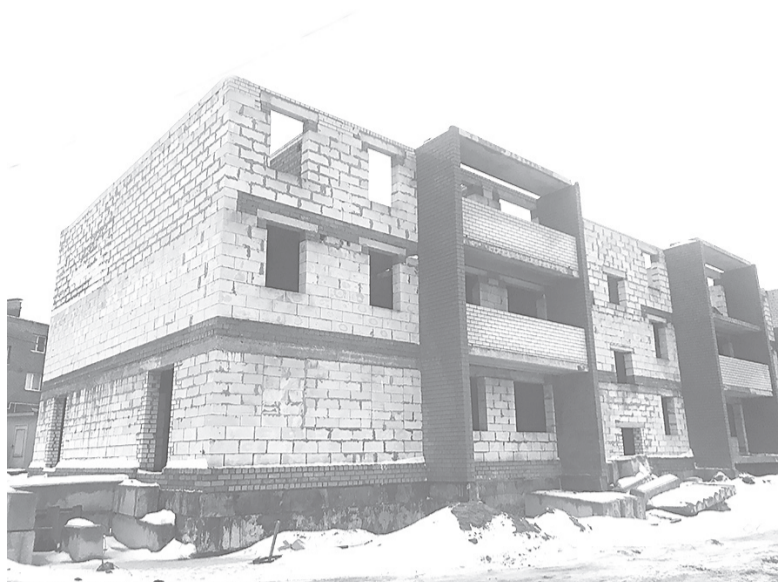
Достраиваемые проблемные объекты в поселке Щедрино