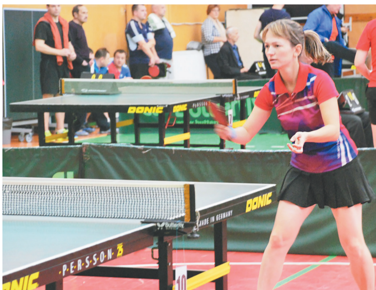
Любимая игра радует и вдохновляет