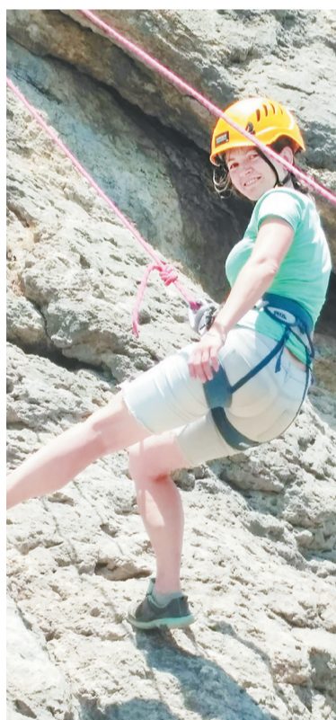
Покорительница горных вершин

В преддверии замечательного праздника – Татьянинного дня, который отмечают 25 января, мы спросили нашу героиню