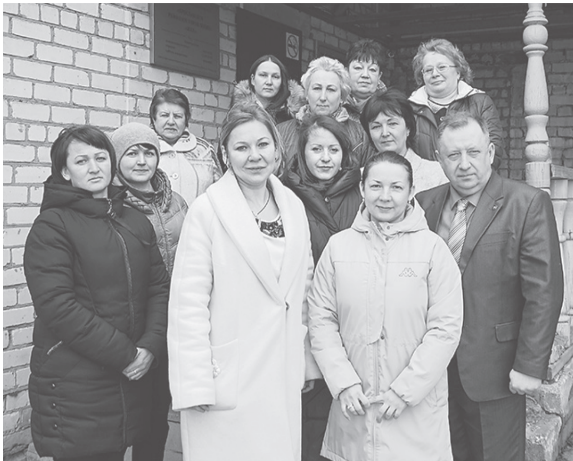
В ООО «ЯРУ «ЖКХ» работают неравнодушные люди

– Как складываются отношения с ресурсоснабжающими организациями, органами местного самоуправления?