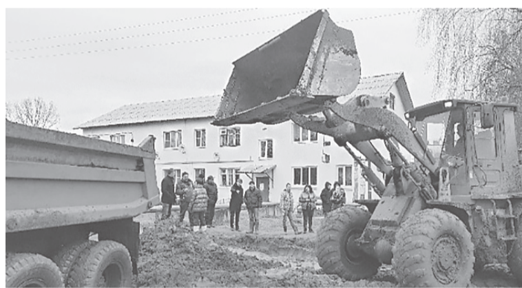
Дорожные работы начались