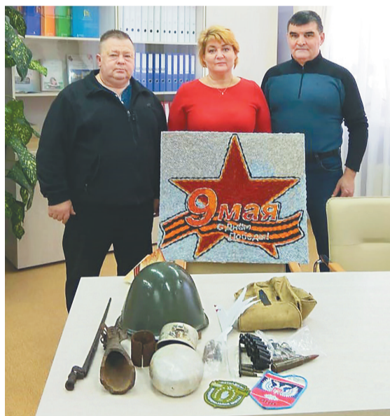
Передача экспонатов для музея

Гости посетили музей, для них была организована экскурсия по школе.