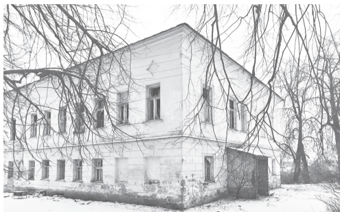
Старинный особняк в Дегтеве, где располагался детский дом