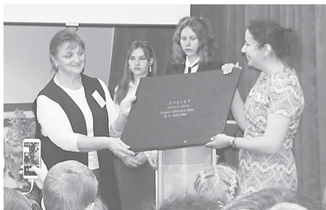
В гостях в школе № 212 Санкт-Петербурга

Мы участвовали во всероссийских, региональных и районных акциях и конкурсах, в региональной научно-практической конференции «Дорогие мои земляки. Герои минувшей войны», где заняли призовые места, а также в областной акции «Наш бессмертный полк. Цена завоеванного счастья». Мы украсили «Окна Победы», прикрепляли к фото в соцсетях георгиевские ленты, исполняли песни военных лет в акции «Поем двором», зажигали «Фонари-