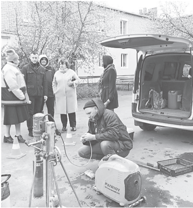
Технадзор контролирует качество работ