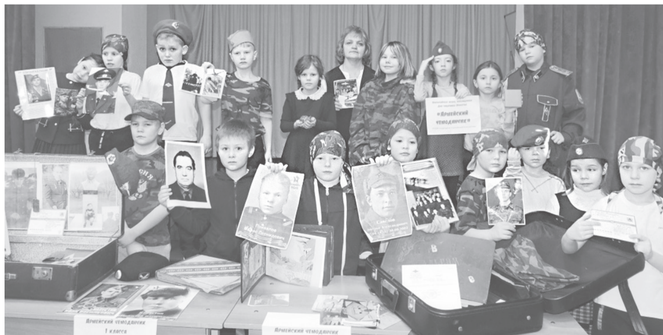
Акция «Армейский чемодан»