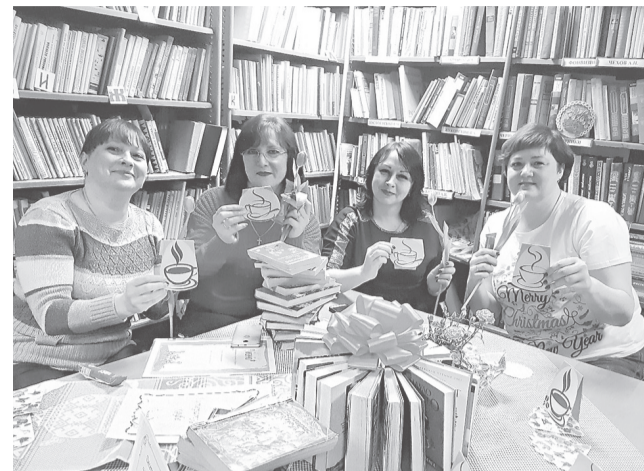
«Литературное кафе» Курбской библиотеки