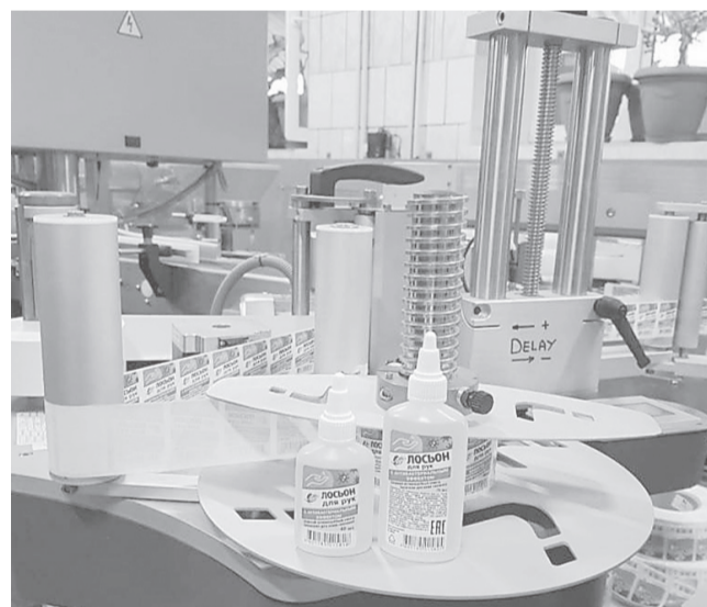
Ярославское предприятие «Луч» начало выпуск актуальной в условиях коронавируса продукции – антисептика для рук. С этой целью переоборудована линия, где производили клей ПВА

бизнеса смогут направить на уплату налогов, сборов, арендные и коммунальные платежи, приобретение оборудования, выплату заработной платы. Стараемся максимально облегчить предпринимателям прохождение этого кризисного периода».