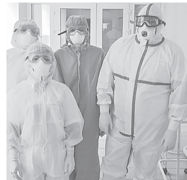
В таких средствах индивидуальной защиты работают сегодня врачи из Карабихи

На повестке дня заседания комитета Ярославской областной думы по здравоохранению 22 мая был один вопрос: о ситуации с коронавирусной инфекцией на территории региона. Состоялась серьезная и острая беседа. Все депутаты получили возможность высказаться.