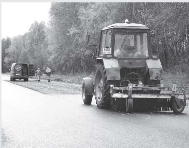
Ремонт дорог в ЯМР

В муниципальной собственности находится 961,7 км дорог, в т. ч. 383,7 км дорог между населенными