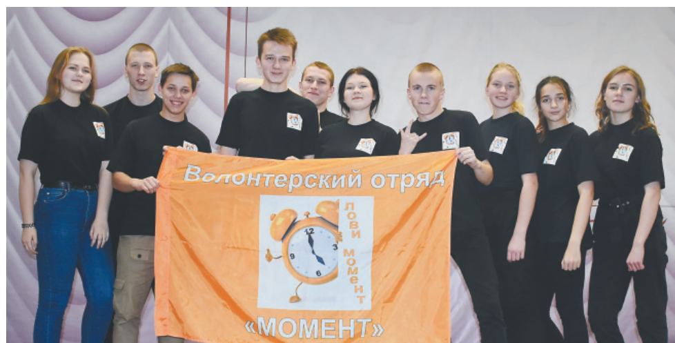
Волонтерский отряд «Момент»

В поселке Заволжье организуют еще один волонтерский отряд. У него уже есть название – «З30 ВОЛЧТ» и первые участники. Сейчас они готовят документы – положение и заявление о включении в муниципальный реестр.