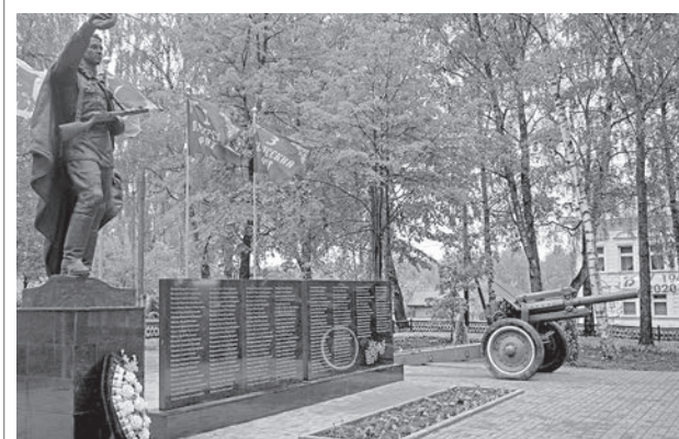
В парке села Толбухино

Основные мероприятия по нацпроектам запланированы на 2020-2024 гг.