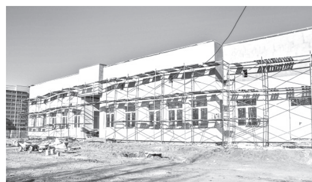
Строительство яслей на 90 мест в пос. Красный Бор

Три года активно работает районный Совет строителей.