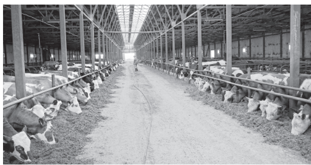
На животноводческом комплексе ООО «Курба»