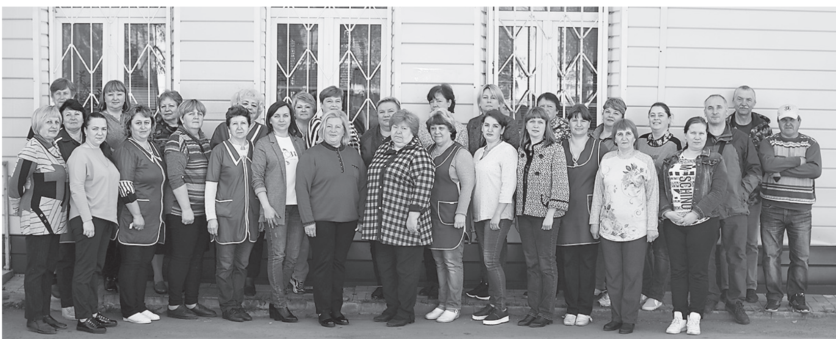
Дружный коллектив КЦСОН «Золотая осень»

Из поздравления главы Ярославского муниципального района Николая Золотникова с Днем социального работника