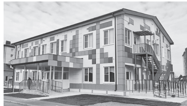
Модульный детский сад в Ивняках

Первоочередные задачи – усовершенствовать нормы градостроительного проектирования, актуализировать Генеральные планы всех поселений, а также Правила землепользования и застройки, продолжить активную работу по восстановлению прав обманутых дольщиков.