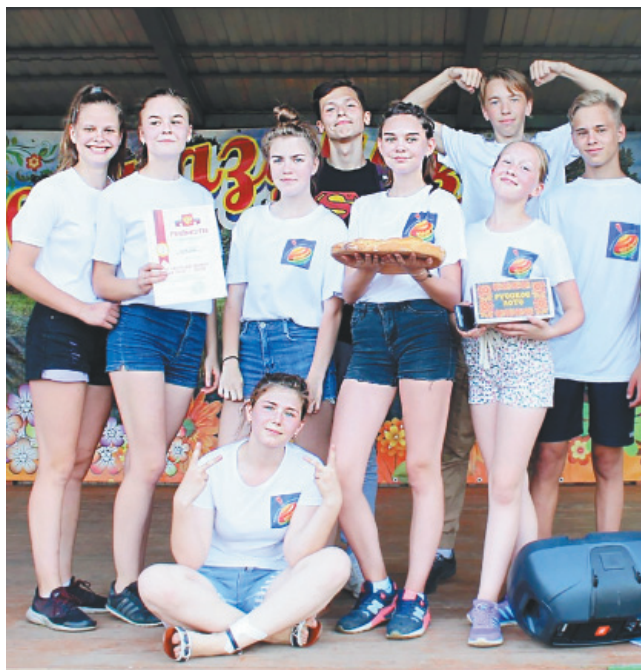
Волонтерский отряд «ВОЛЧОК»

только Ярославский район, но и Ярославль. Организация субботников, помощь Туношенскому пансионату для ветеранов войны и труда,