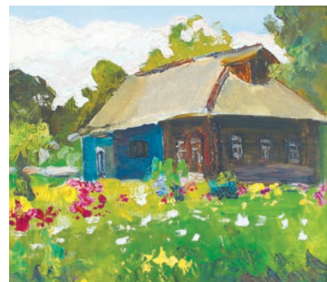
● Юрий Казаков. «Село Васильевское. Дом Николаевых»