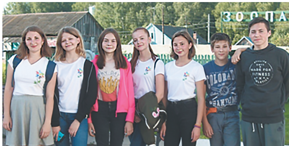
Волонтерский отряд «Добрые руки»