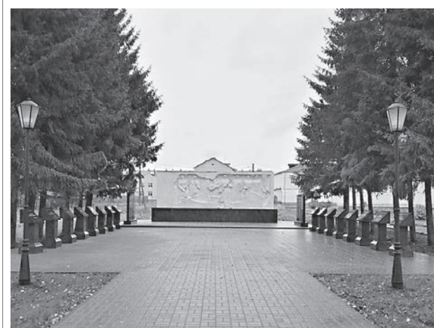
Аллея героев в селе Туношна