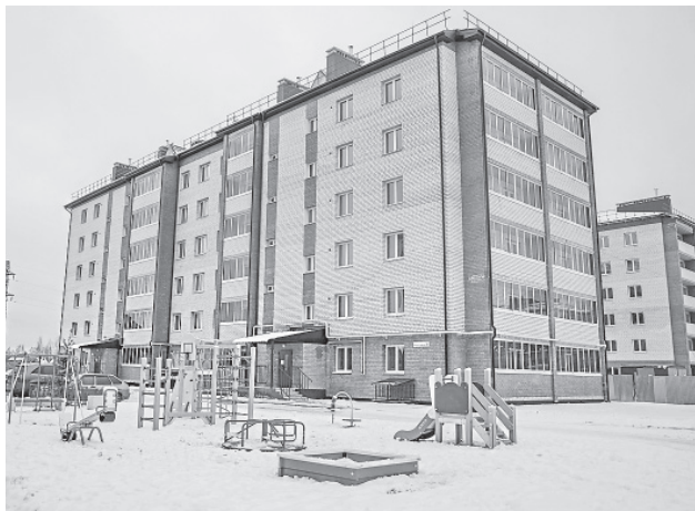
Новостройки поселка Ивняки

В ЯМР работают более 18 застройщиков, из них 8 крупных: ООО «Берега-Строй», ООО «Родные просторы», ООО «Экогород», ООО «Светлояр» ООО «Желдорипотека», ООО «Форум», ООО «Гранит», ООО «Август».