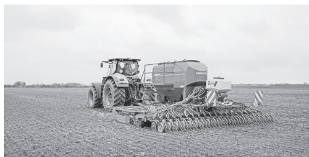
На полях АО «Племзавод «Ярославка»

Несмотря на снижение поголовья коров, район занимает лидирующие позиции по валовому производству молока в области. В лидерах по надоям на одну корову: ООО «Племзавод «Родина» – 12 961 кг, ООО «Агромир» – 8 622 кг, ООО «Меленковский» – 8 208 кг, АО «Племзавод «Ярославка» – 8 131 кг, ЗАО «Агрофирма «Пахма» – 8 096 кг. Два предприятия в районе имеют собственные цеха переработки цельного молока. ЗАО «Агрофирма «Пахма» и АО «Племзавод «Ярославка» производят широкий ассортимент молочной продукции, которая пользуется большим спросом.