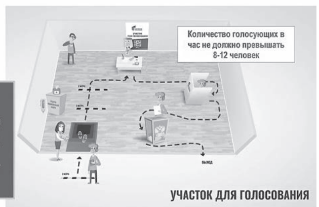
УЧАСТОК ДЛЯ ГОЛОСОВАНИЯ