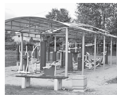
Спортивная площадка у ДК в селе Сарафоново