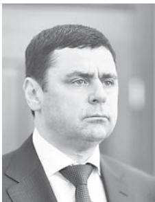
Губернатор Ярославской области Дмитрий Миронов