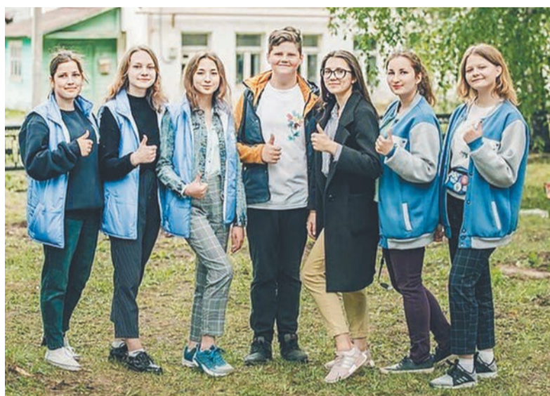
Волонтеры из отряда «Добрые руки»