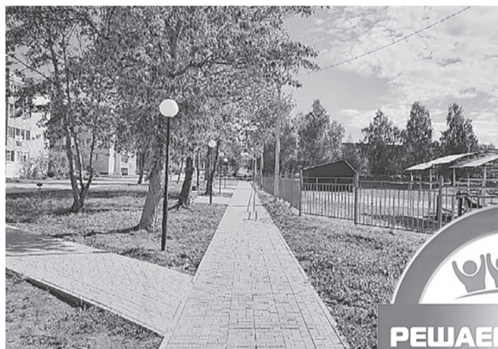
Благоустройство поселка Дубки Карабихского сельского поселения

– Совершенно верно. Уровень явки повысит вероятность того, что