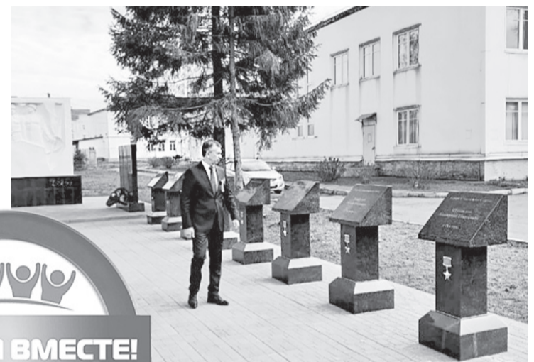
Аллея Героев в селе Туношна