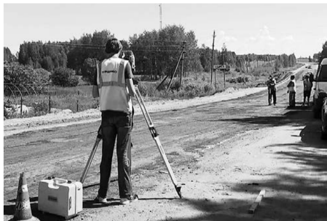
Ведутся работы на дороге Толбухино – Уткино – Спас-Виталий

кстати, выросла на 1 млн и теперь превышает 14 млн руб. благодаря тому, что район принимает прокуратура по вопросу законности его установки.