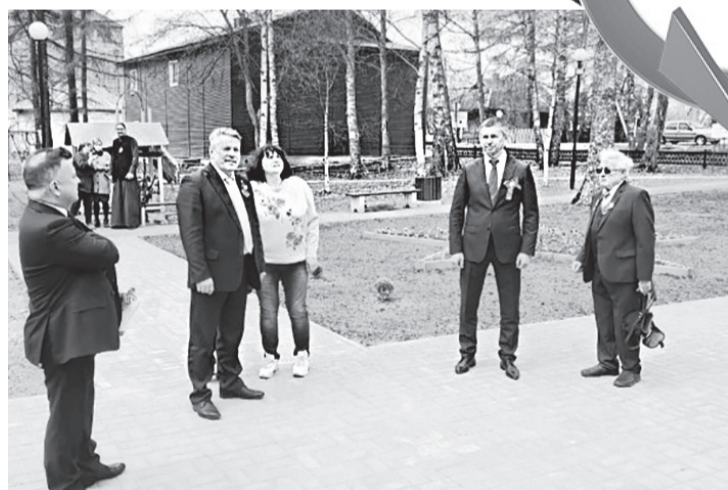
Благоустройство парка в центре села Толбухино