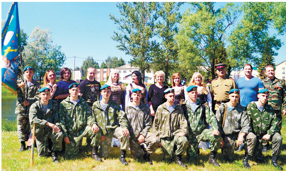
Участники праздника в честь 75-летия Победы

Наш район с большим интересом поддерживает все акции, а жители активно принимают в них участие. Мы чтим память о наших героях!