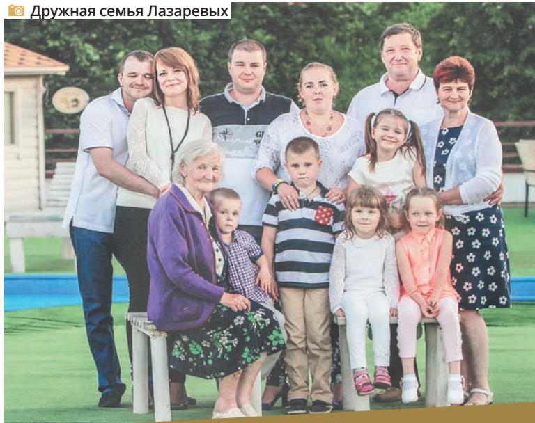
Дружная семья Лазаревых

А как же дистанционная торговля? В «Лазаревском» уверены, что она хоть и будет развиваться, но вряд ли достигнет большого успеха. Во-первых, цветы, рассада и саженцы – очень специфичная группа товаров ограниченного срока хранения. Если их вовремя не доставить, они начинают болеть и гибнуть. Во-вторых, при интернет-заказах невозможно визуально оценить продукцию. Ведь нет абсолютно одинаковых растений, это живые организмы, каждый со своими особенностями. Кроме того, многие специально приходят в магазин, чтобы посоветоваться, получить консультацию по уходу за растениями.