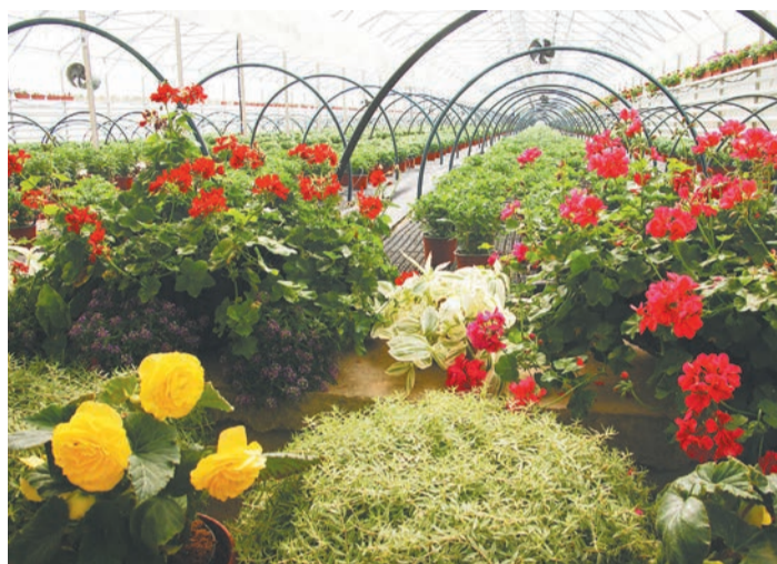
Красота спасет мир