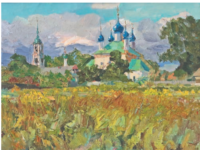
«Осенний ветер. Село Васильевское»