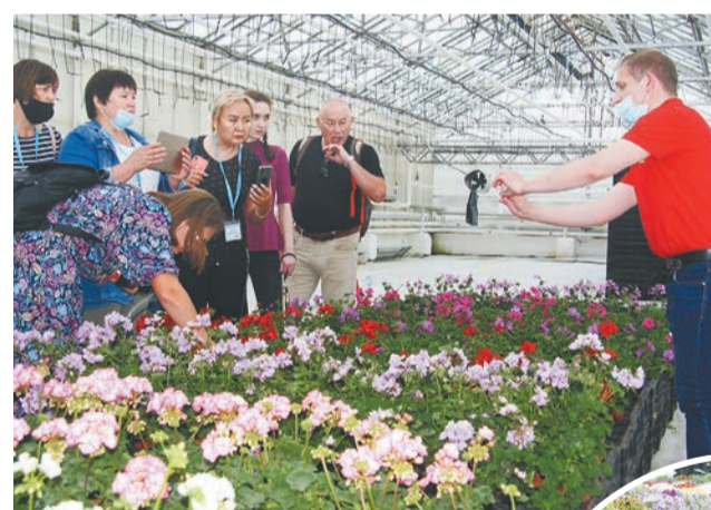
В теплице комбината