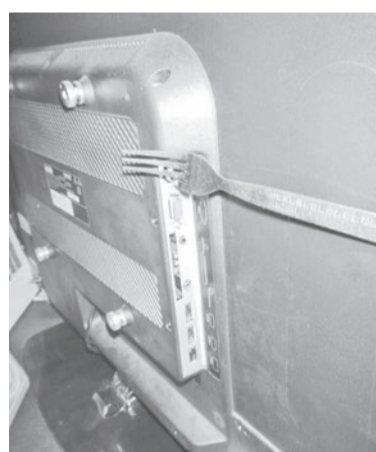
Такую антенну из столовой вилки обнаружили связисты у зрителя, который жаловался на пропадание сигнала. После замены приемной антенны проблемы исчезли.

Немного теории. Цифровое эфирное телевидение показывает без помех, оно либо есть в отличном качестве, либо его нет совсем. Поэтому в случаях, когда картинка на экране то четкая, то полностью пропадает, диагноз ясен: антенна принимает сигнал на пределе возможностей. И любое изменение условий приема – распутившиеся листья, дождь, проехавшая мимо машина – изменяет сигнал до такого уровня, что его мощности для этой антенны не хватает. В аналоговом телевидении на экране пошли бы помехи. «Цифра» исчезает совсем. Вывод прост: надо подобрать под-