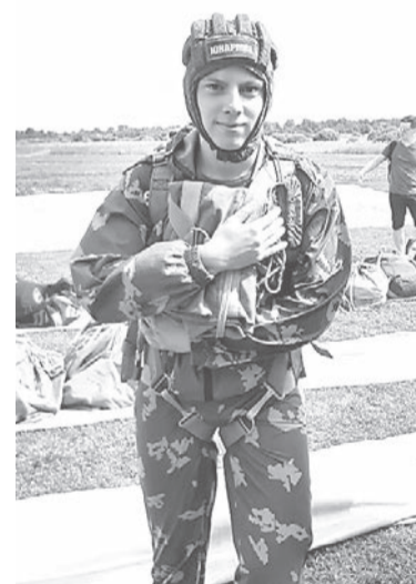
Фото этих и других замечательных ребят из Ярославки, готовящихся служить Родине, мы публикуем на этой странице.

стрикова и Виктории Халезовой. Все получили поздравления, в том числе и в группе ВПК «Патриот» поселка Ярославка в социальной сети «ВКонтакте».