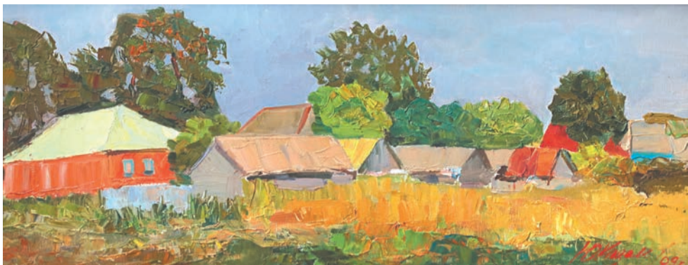
«Вечер в деревне»