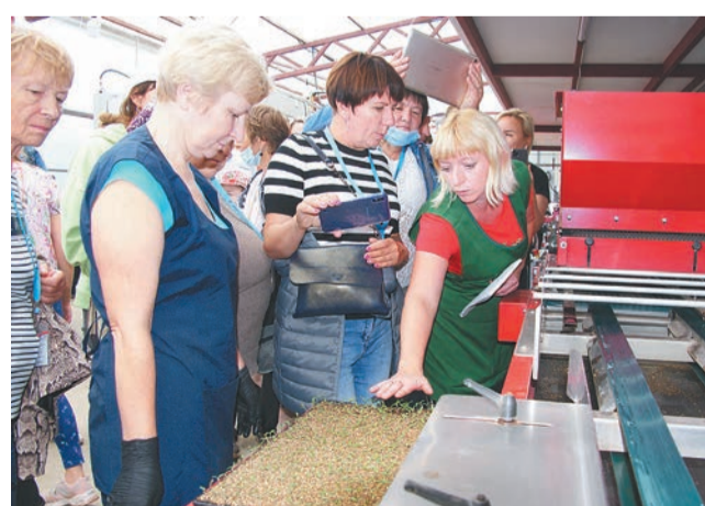
Работники хозяйства делятся опытом

ООО «Тепличный комбинат «Лазаревское» работает в Ярославской области с 2005 года. Это современный комплекс по производству и продаже цветов на срезку, комнатных растений, рассады, саженцев. Здесь трудится команда профессионалов с многолетним агрономическим опытом. Комплекс входит в ассоциацию «Теплицы России», его партнеры – администрация Ярославской области, мэрия Ярославля, крупные финансовые, спортивные, развлекательные предприятия региона. Ежегодно «Лазаревское» представляет более миллиона единиц рассады цветов и овощной рассады. В его теплицах произрастает более 20 сортов роз, лилий, а к 14 февраля и 8 Марта выращивается более 1 000 000 тюльпанов.