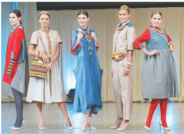
Коллекция «Северное Трехречье» Архангельская область