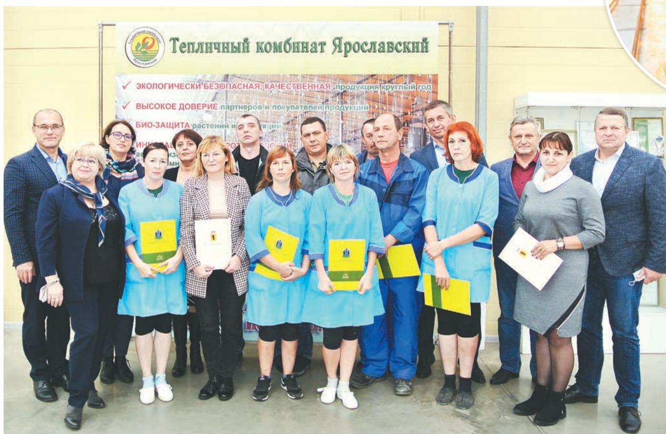
Представители трудового коллектива ООО «ТК «Ярославский» с гостями предприятия

ПСХК «Искра» – крепкое и стабильно работающее хозяйство. Здесь высокие надои (8 012 кг молока на корову по итогам 2019 года), хорошая урожайность зерновых. Выращивают и карто-