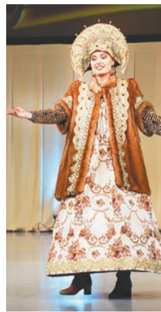
Коллекция «Вдоль по Питерской»