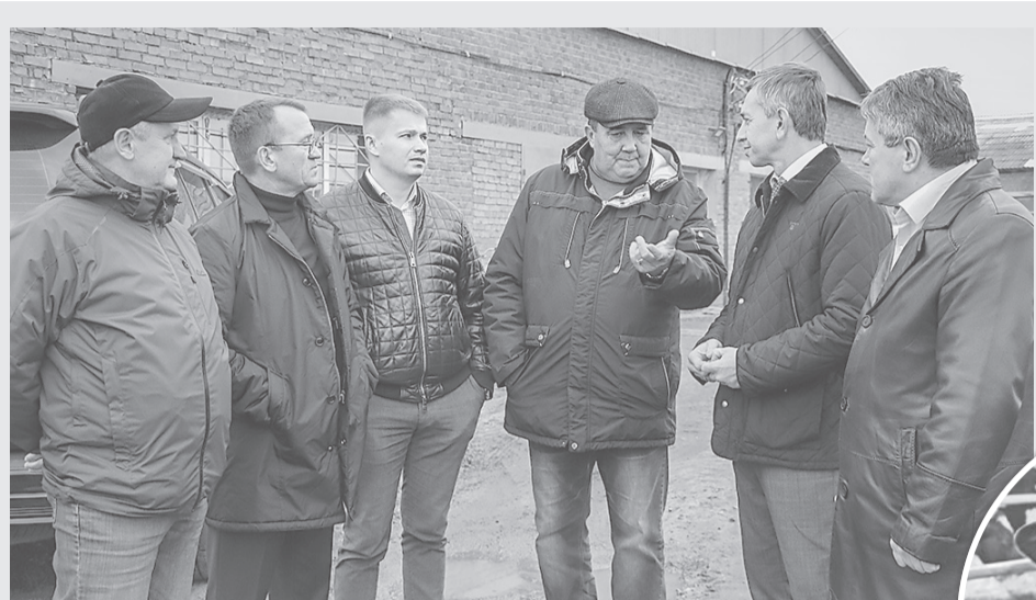
Руководство ООО «Агромир» и гости хозяйства