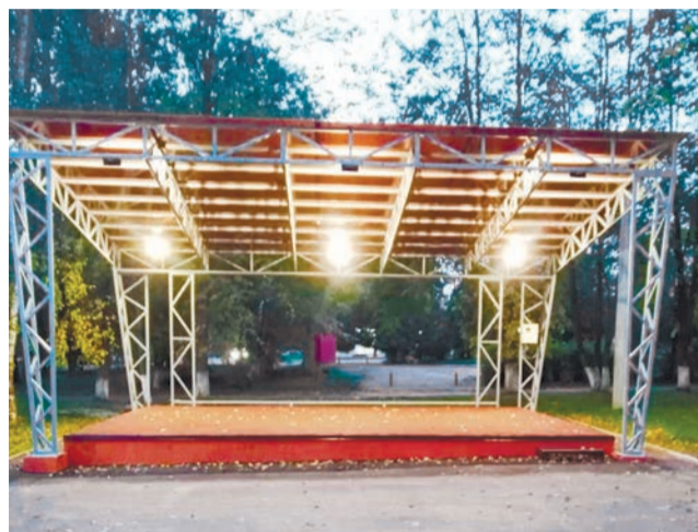
Культурно-парковый комплекс в Кузнечихе

Благоустройство – одно из ключевых направлений, требующих тесного взаимодействия граждан и власти. Таким способом благоустраивают дворы и улицы, устанавливают малые архитектурные формы, монтируют наружное освещение, обустривают парки и скверы, ремонтируют учреждения культуры, решают проблемы в сферах образования, спорта и ЖКХ. Финансовая помощь из федерального и областного бюджетов предоставляется на конкурсной основе – согласно адресам, поддержанным населением на собраниях в поселениях.