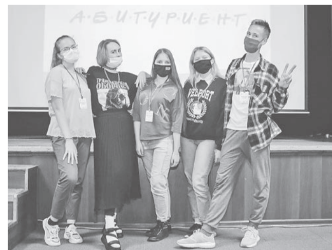
Команда «Мы – лидеры!»

Слаженная командная работа, умение нестандартно мыслить и находить выход из сложной ситуации, а также личные качества позволили юным лидерам из ЯМР одержать победу!