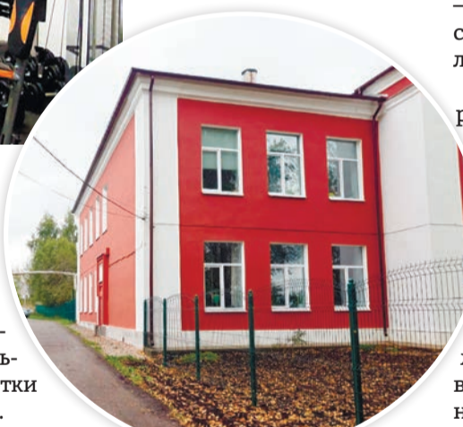
Карабихская школа после ремонта

в годы войны в поселке Красные Ткачи, ремонт и оснащение часовни в поселке Ивняки. Установлена детская площадка на улице Железнодорожной в поселке Лесная Поляна. В рамках данного направления решили приобрести спортивную форму для сборных команд Ярославского района, а также тренажеры, спортивный инвентарь и станки для занятий танцами в тренажерный зал дома культуры села Андроники.