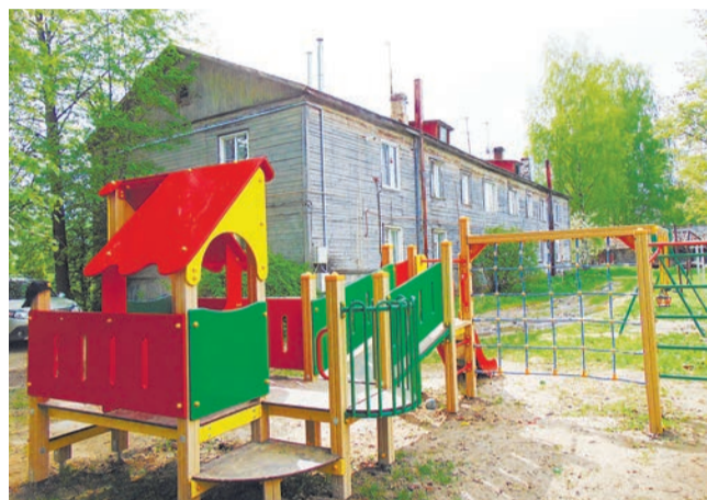
Лесная Поляна. Детская площадка на улице Железнодорожной

Проект «Решаем вместе!» направлен на повышение комфортности проживания в Ярославской области и нашем районе, вовлечение граждан в решение первоочередных проблем местного значения. Он давно получил признание жителей региона.