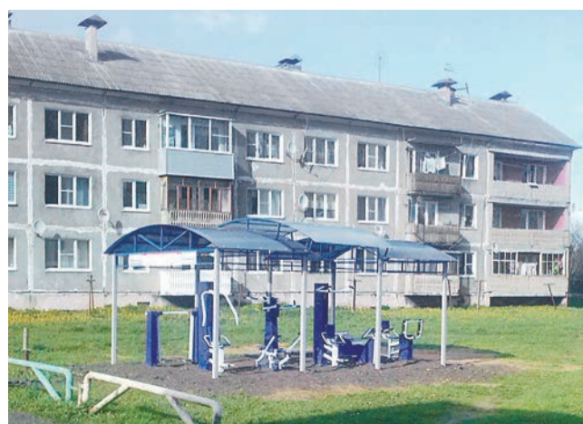
Готовый объект в селе Курба

По всем объектам подготовлена сметная документация, которая проверена государственной экспертизой.