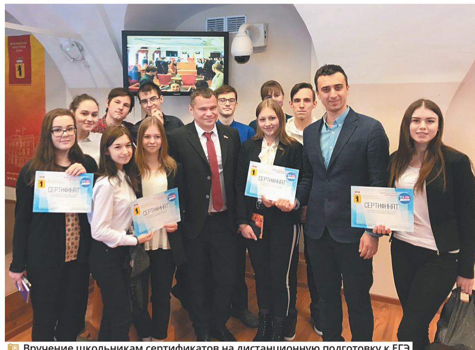
Вручение школьникам сертификатов на дистанционную подготовку к ЕГЭ

Также в ведении комитета вопросы социального развития села. Здесь на помощь приходит федеральная программа «Развитие сельских территорий». Это и льготная ипотека, и строительство социальных объектов, и разви-