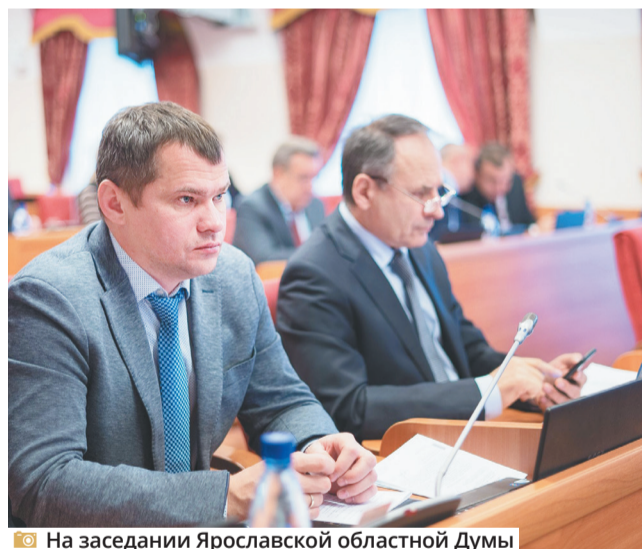
На заседании Ярославской областной Думы

Самые объемные работы проведены в Карачихской основной школе, где отремонтированы фасад основного здания с устройством водосточной системы, цоколь, отмостка, крыльцо и частично – кровля. Заменены окна на ПВХ в коридорах, выполнен ремонт кабин-