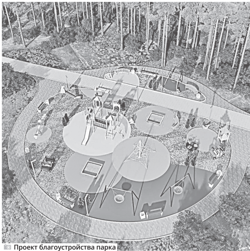
Проект благоустройства парка