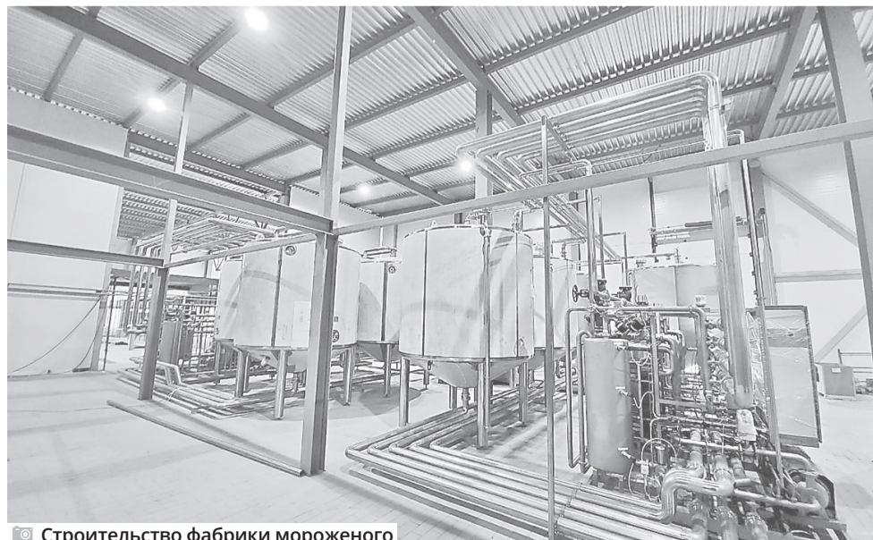
Строительство фабрики мороженого

Также работает на территории фирма «Август» – крупнейшая российская компания по разработке, производству и информационно-технологическому сопровождению при применении химических средств защиты растений. Она уже сотрудничает с такими сельхозкомпаниями региона, как «Красный маяк» и «Курдумовское».