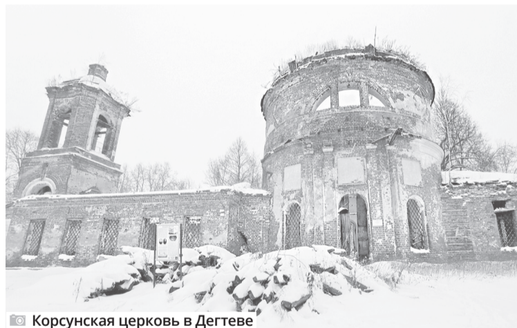
Корсунская церковь в Дегтеве

храм как свидетель, а значит и мученик, стоит, наверное, из последних сил, напоминая нам всем, чтобы мы всегда оставались людьми и жили по законам Божиим.