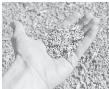
☑ Качественные семена – важнейшее условие успешной посевной

В хозяйствах продолжается ремонт сельскохозяйственной техники и оборудования, ведется работа по приобретению минеральных удобрений, горюче-смазочных материалов и семян, а также по вывозу на поля органических удобрений (на 12 марта – 161 тыс. т).