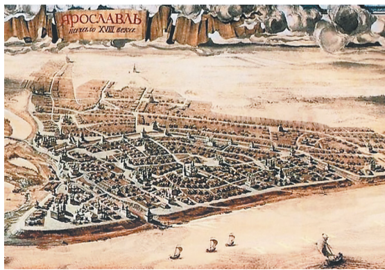
Вид Ярославля. Конец XVII – начало XVIII века. Реконструкция. Архитектор В.Ф. Маров, художник В.Н. Решитов

ИЗДАЕТСЯ С 1 НОЯБРЯ 1937 ГОДА. ВЫХОДИТ ПО ЧЕТВЕРГАМ