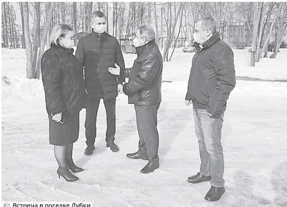
Встреча в поселке Дубки