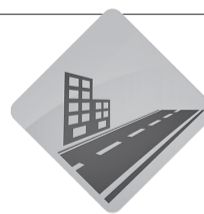
БЕЗОПАСНЫЕ И КАЧЕСТВЕННЫЕ ДОРОГИ

В рамках проекта в 2020 году на участках автомобильных дорог областной собственности в границах Ярославского района: Климовское – Ананьино – Волково, Ярославль – Любим; Туношна – Бурмакино; Кормилицино – Курба; Карачиха – Ширинье; Толбухино – Уткино – Спас – Виталий; Ярославль – Туттаев (левый берег) и му-