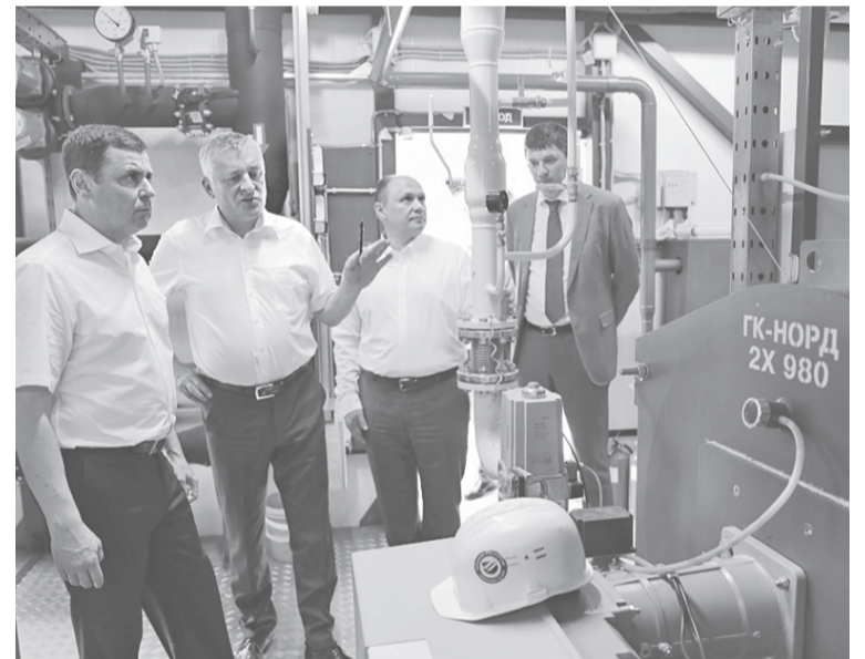
Губернатор Дмитрий Миронов знакомится с новым объектом