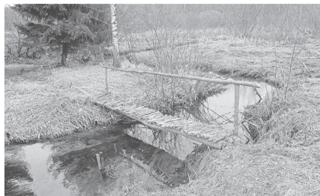
Река Пажица весной