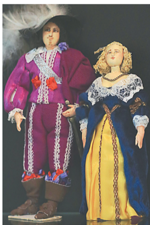
Костюм эпохи мушкетеров