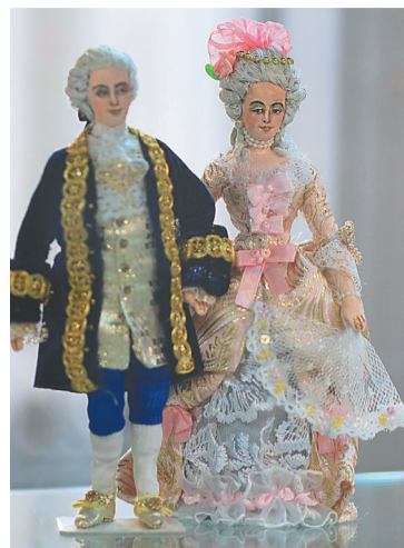
Костюмы XIX века