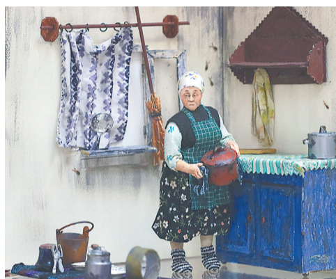
Композиция «Федорино горе»