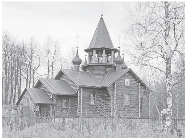
Храм иконы Божией Матери «Всех Скорбящих Радосте»