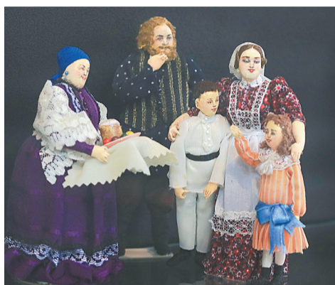
Праздник Пасхи в купеческой семье