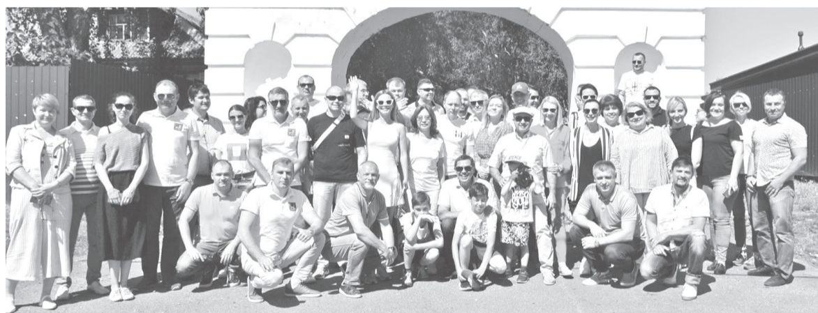
Гости в Карабихе

социально-экономическим положением и предприятиями муниципального образования. После деловой части посетили музей-заповедник «Карабиха». Завершилось совещание в парке активного семейного отдыха «Забава», где омбудсмены приняли участие в интеллектуальном квесте.