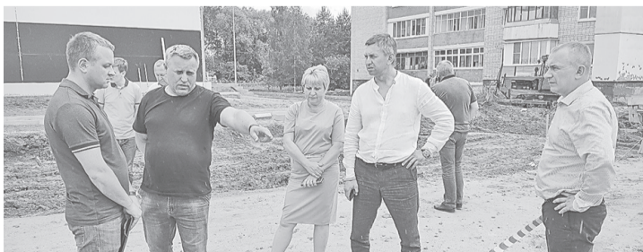
Рабочее совещание на стройплощадке

ная стоянка для персонала и посетителей, а также площадка для отдыха.