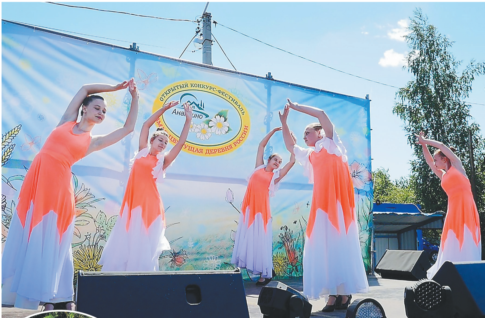
Выступление ансамбля эстрадного танца «Фейерверк» Ананьинского ДК