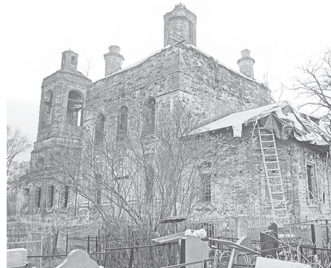
Храм Рождества Пресвятой Богородицы

еся на иконах над главой Богородицы». Рядом с храмом на кладбище устроена деревянная часовня в честь Всех Святых. Высажены елочки, сосны. Летом кладбище усердием прихожанок утопает в цветах. Сохранилась фрагменты усадебной планировки, старинного парка и прудов. На кладбище – надгробный камень по сторонам лица драго-