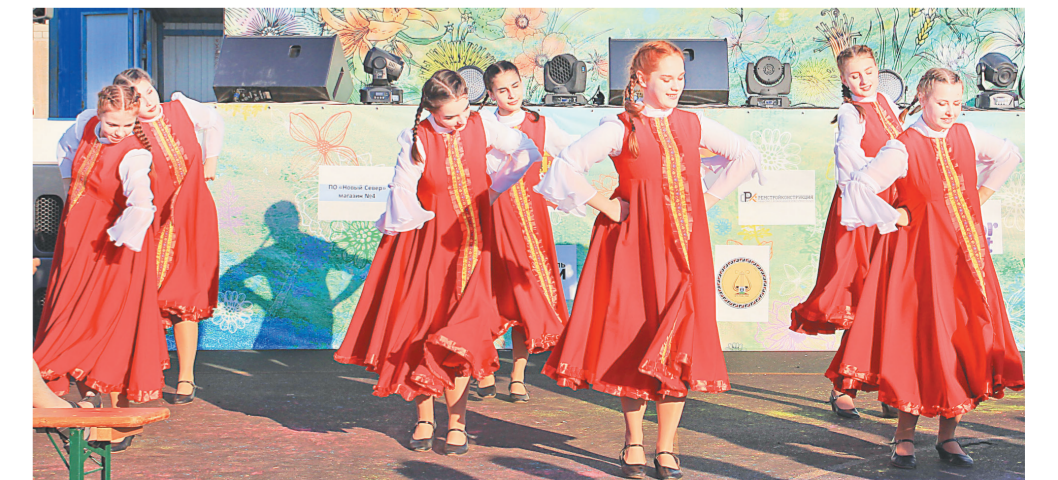
Танцевальный коллектив «Радуга»

Праздник завершился зажигательной дискотечкой и салютом.