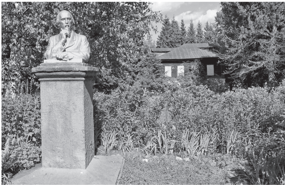
Грешнево. Памятник Н.А. Некрасову на фоне музыкантской – единственного сохранившегося здания усадьбы

же после смерти Алексея Сергеевича вместе с братом Федором сонаследником имени, он в 1872 году отдает свою долю другому брату – Константину, окончательно разрывая связь с этим местом.