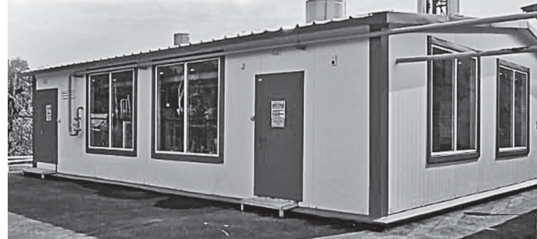
■ Курба. Новая газовая котельная

Кроме того, Ярославский район уже посетила комиссия ГКУ «Центр управления жилищно-коммунальным комплексом Ярославской области». Они про-