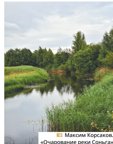
Максим Корсаков. «Очарование реки Соньга»