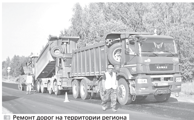
Ремонт дорог на территории региона

«Ярославль является столицей Золотого кольца, и было бы очень хорошо в рамках развития туристической деятельности закольцевать наши малые города и сделать