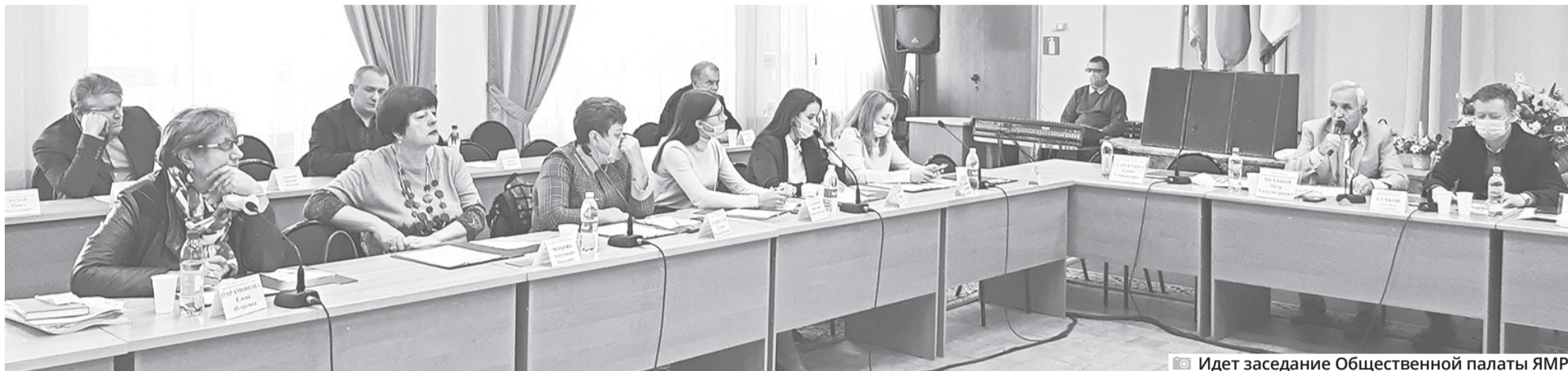
Идет заседание Общественной палаты ЯМР