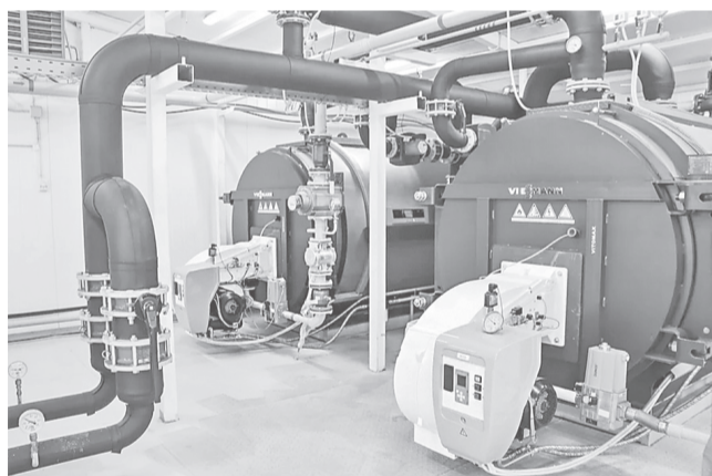
В поселения ЯМР приходит газ. Новые модульные котельные в Курбском СП