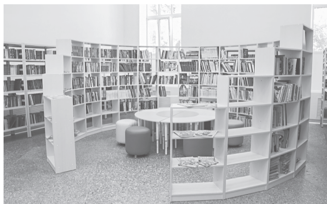
В обновленной библиотеке Сарафоновского дома культуры