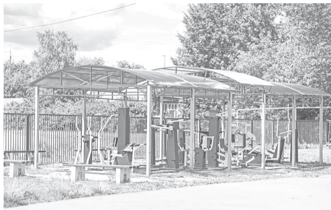
Площадка для воркаута в селе Сарафоново