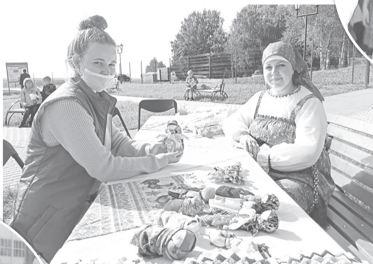
Мастер-класс по изготовлению кукол дают волонтеры из села Спас-Виталий

В поселке Красные Ткачи в День района силами померились футболисты, баскетболи-