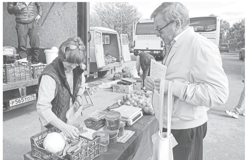
На ярмарке продукции сельхозпредприятий Ярославского района

Ярмарка сельхозпредприятий района встречала разнообразием плодов нового урожая. Помидоры, лук, картофель, огурцы, свекла... Свою продукцию предлагали тепличный комплекс «Туношна», тепличный комбинат «Ярославский» и сельхозпредприятие «Бурмасово». Кроме овощей в продаже