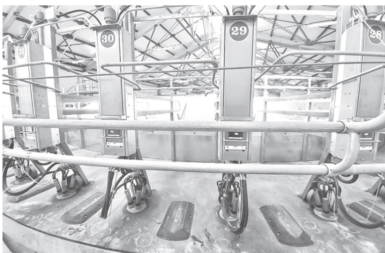
Молочно-товарная ферма в «Пахме»

– Реализуемые в области молочного животноводства проекты чрезвычайно важны для нашего региона, – отметил заместитель председателя правительства региона Валерий Холодов. – Для наращивания объемов производства молока в регионе реализуют семь крупных инвестпроектов на 9,5 млрд рублей. Благодаря этому поголовье крупного рогатого скота вырастет более чем на 13 тысяч голов. Новые проекты дадут свыше 360 рабочих мест.