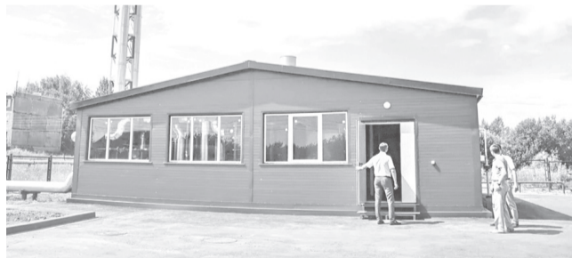
Новый ФОК в поселке Красные Ткачи

Один блок вопросов, обсуждавшихся на встрече, касался развития социальной сферы.