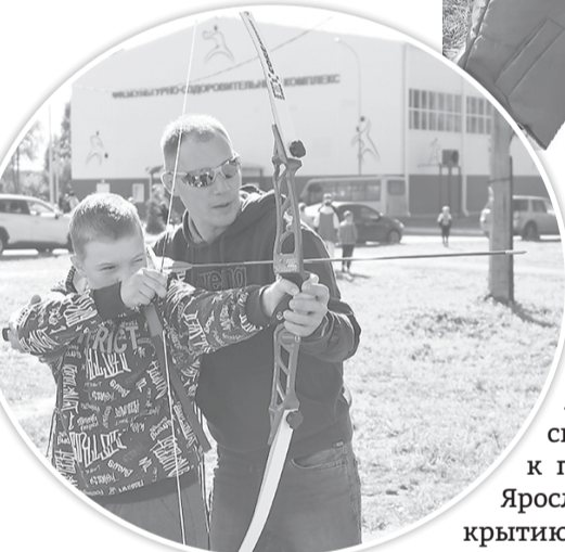
Стрельба из лука точно в цель

Свои пожелания газете адресовали и другие читатели, в том числе представители админи-