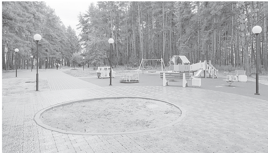
Первый этап создания «Экопарка» в Заволжском сельском поселении завершен

Благодарю за внимание к моей просьбе. Спасибо, что вы подключаетесь к решению этих важных для области вопросов. Вы любите ярославцев, и они вам тем же отплатят», – сказала Терешкова.