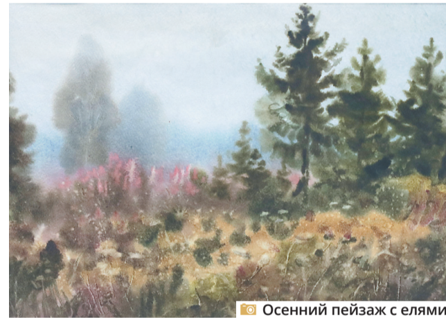
Осенний пейзаж с елями