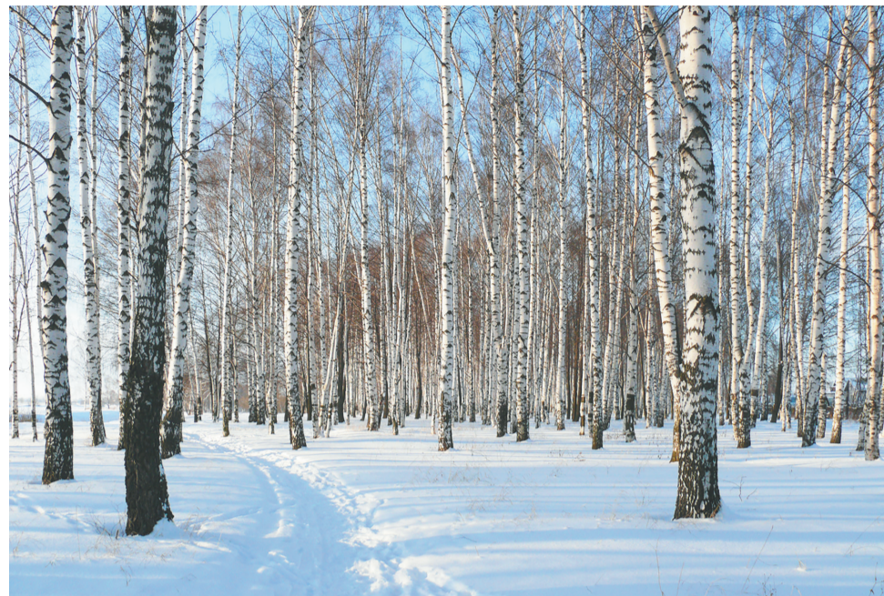
Березовая роща в феврале.