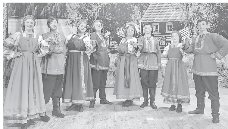
Народный ансамбль «Кузница» Кузнецкихинского дома культуры

Дистанции: 1 км; 2,5 км; 5 км. Место старта: д. Черелисино