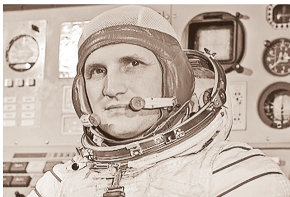
Космонавт Б.В. Волюнов