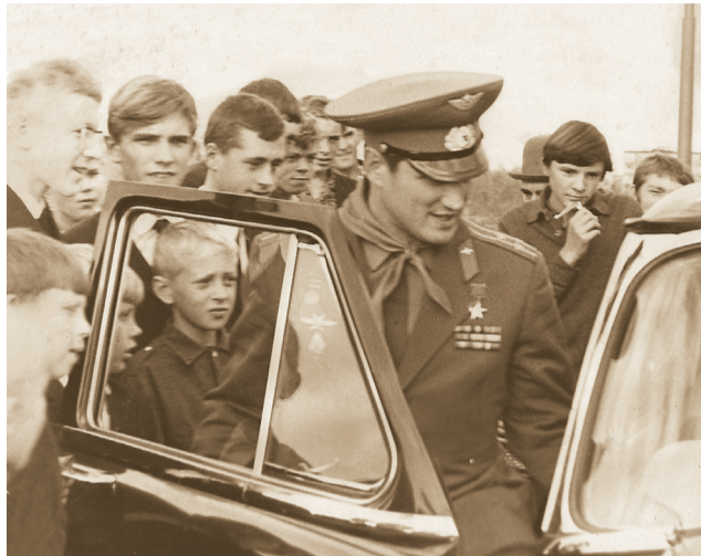
Летчик-космонавт Б.В. Волюнов во Дворце пионеров 16.09.1970.

...Нужно было посмотреть, как может работать, как ведет себя женский организм, исследовать его особенности, его работоспособность, его возможности в космическом