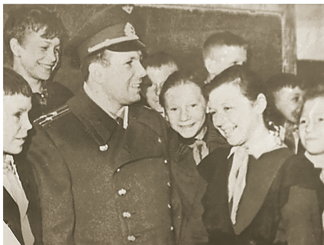
Ю.А. Гагарин в Карачихе

полете. Надо сказать, что Валентина Владимировна выполнила свой полет очень хорошо, замечательно выполнила. Полет ее был рассчитан всего на одни сутки, и программа полета. Но когда смотрим, Валентина летает одни сутки, передает по радио, что самочувствие нормальное: «Самочувствие отлично, чувствую себя хорошо, машиной управляю, слушается все