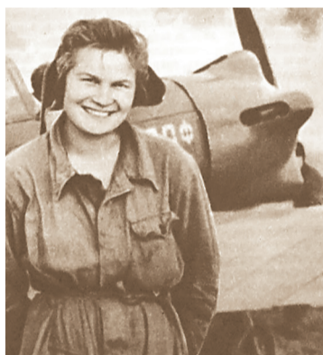
В.В. Терешкова в аэроклубе