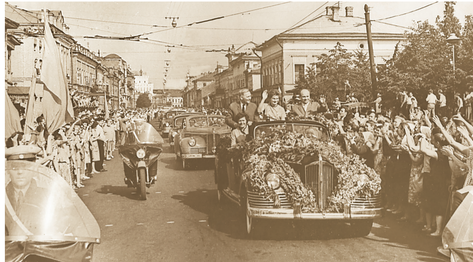
Ярославцы встречают В.В. Терешкову 18 июля 1963 года