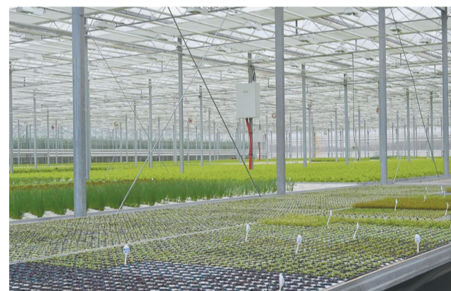
В тепличном комплексе

– Обучение позволило под другим углом посмотреть на производственные потоки, процессы, а также научило выявлять потери и их устранять. Хотя у нас специфика производства и отличается от процесса, представленного на «Фабрике процессов», но мы видим, что проблемы одни и те же, а значит, и подходы, способы их решения актуальны и в нашем случае, – рассказали на предприятии.