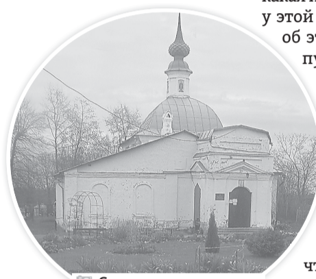
Смоленская церковь в Шопше