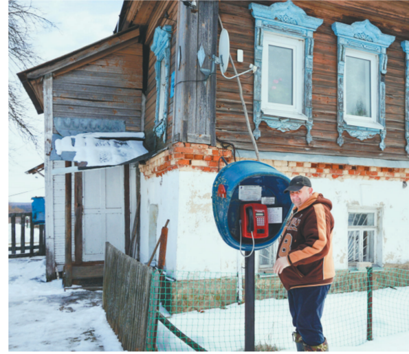
Здание, в котором находится почта