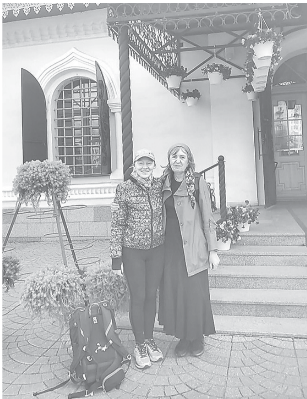
В начале пути

● Лариса Фабричникова