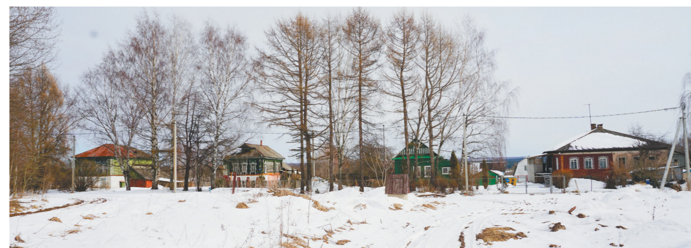
Старинные дома села Красное

Отметим, что это выявленный объект культурного наследия конца XIX – начала