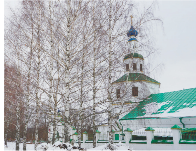
Храм Воскресения Христова