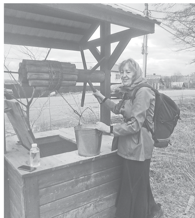
У колодца в Карабихе

лись у понравившихся нам домиков, восхищались трогательными валиками из бумаги и ваты с елочными игрушками между рамами. Давно я такого не видела. Наслаждались зеленеющими нежными облачками лесов, речушками, которые весело бежали по камушкам, почувствовав себя большими. Изрядно разлились они в половодье. Останавливались у колодцев испить студеной чистой воды. Заходили в храмы, встречавшиеся нам пути, а если они были