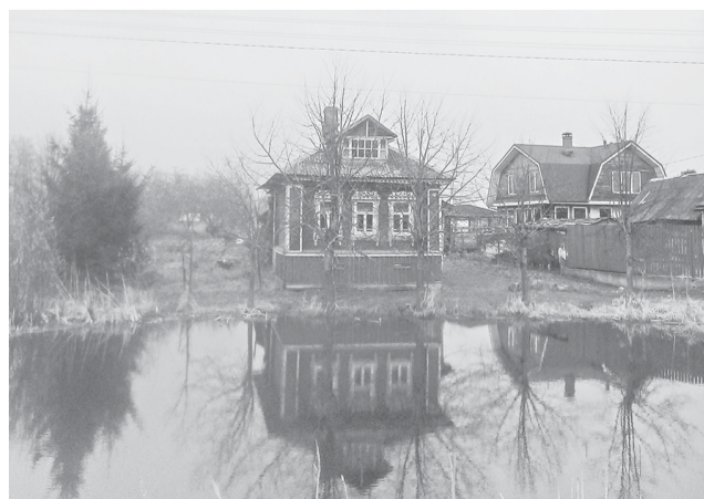
Деревянные дома с резными наличниками радуют глаз