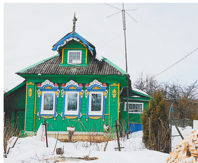
Дом Бузиных – как сказочный терем

По своей объемной композиции и декору церковь в Красном напоминает памятники ранней стадии развития нарышкинского барокко. Рядом с храмом поднимается к небу стройная шатровая колокольня середины XVIII века. Общий облик памятника отличается своего рода недосказанностью. В интерьере Воскресенской церкви сохранились нарядный барочный иконостас XVIII столетия, старинные иконы XVII-XVIII веков, настенная живопись позапрошлого столетия.