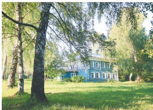
Село Аббакумцево. Школа