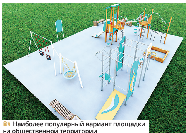
Наиболее популярный вариант площадки на общественной территории