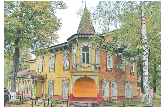
☞ Дом фабриканта Н.И. Сакина, 1910 год, поселок Красные Ткачи

– Первые такие стенды установлены в 2017 году в Курбе и Толбухи-