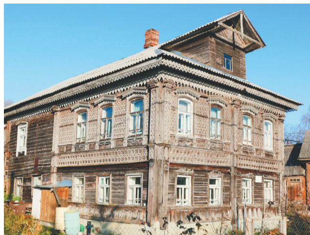
☞ Дом священников Лебедевых, XIX век, село Дегтево

вание около 50 объектов культурного наследия. Появляются новые туристические маршруты, расскажите о них.