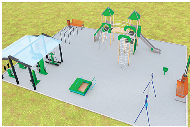
Этот вариант дворовой площадки предпочли жители

Все объекты находятся на контроле администра-