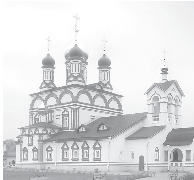
Троице-Сергиев Варницкий монастырь