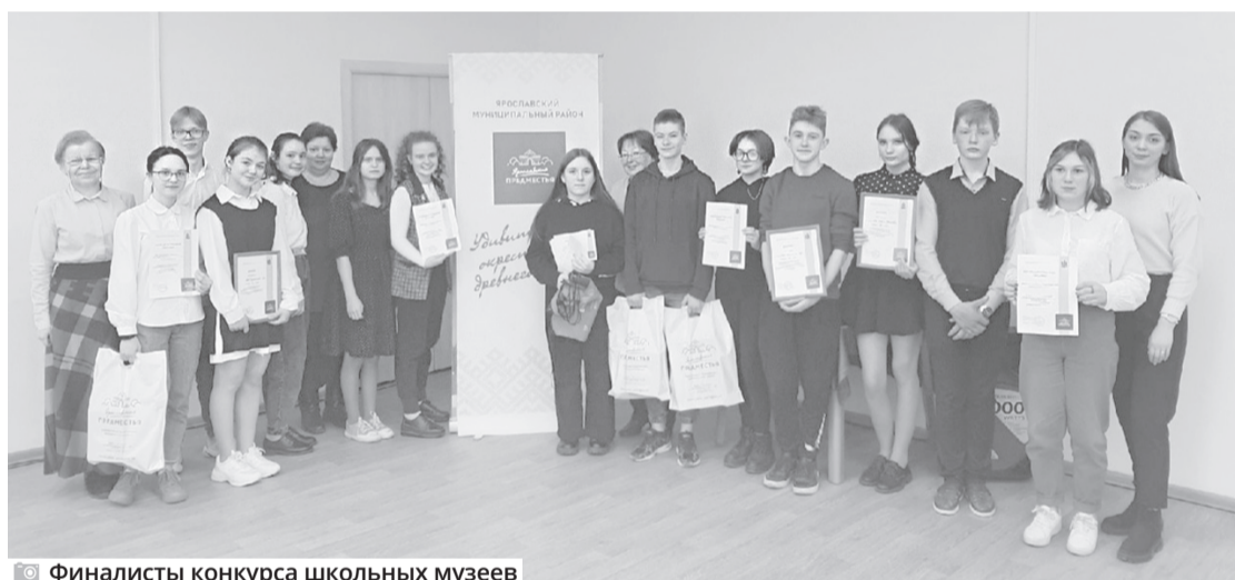
Финалисты конкурса школьных музеев