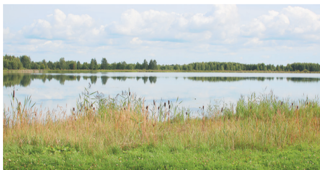
Озеро Печельское (Кудринское)

Костромской области – места, которые когда-то привлекли внимание Николая Некрасова, где он жил или охотился, писал стихи и поэмы, можно увидеть на фотографиях Ирины Штольбы.