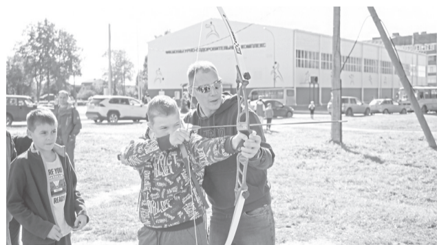
Стрельба из лука – новый для нашего района вид спорта

« Число видов спорта, которыми можно заниматься в ЯМР, увеличилось