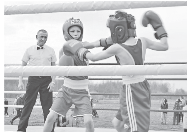
Бокс в Левцово

– Логично спросить про состязания, которые