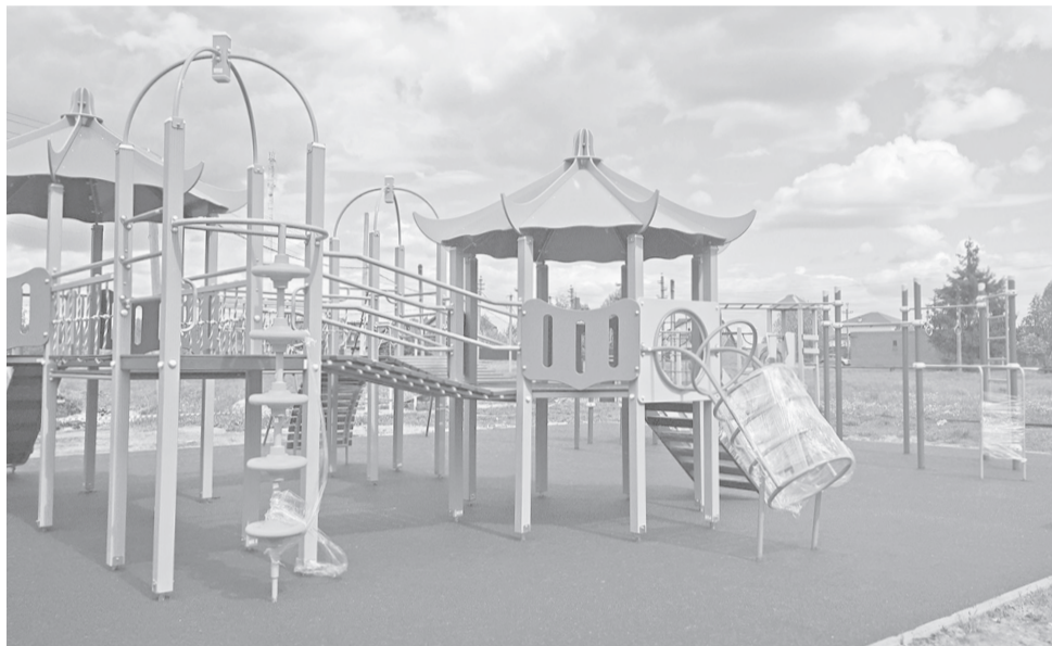
Общественная игровая площадка за домом культуры в деревне Глебовское готова. Идут приемка работ и оформление документации

ках нацпроекта «Формирование комфортной городской среды» в поселке Щедрино – на улице Парковой, у домов 16, 17, 18, 20, 21. Подрядчик планирует финишировать здесь к середине июня. В настоящее время на указанной территории идут субботники с жителями по озеленению.