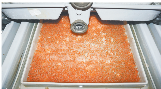
В инкубационном цехе

Форель (семейство лососевых) относится к ценным породам рыб. Ее мясо богато белком, микроэлементами и витаминами. Родина форели – пресные водоемы Тихоокеанского побережья Северной Америки, но акклиматизирована она во многих странах мира. В нашей стране в середине 1970-х годов выведена отечественная порода – форель радужная.