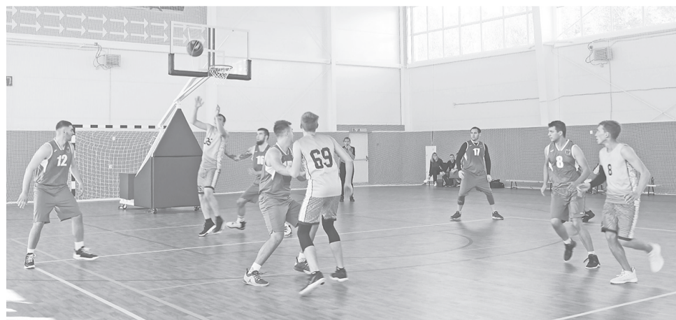
Баскетбол в ФОКе поселка Красные Ткачи

« Умные площадки – это уникальные объекты, оборудованные беспроводной локальной сетью Wi-Fi, где каждый житель сможет с комфортом заниматься спортом, в том числе в режиме онлайн