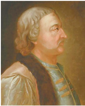
Борис Алексеевич Голицын, «дядька» Петра I