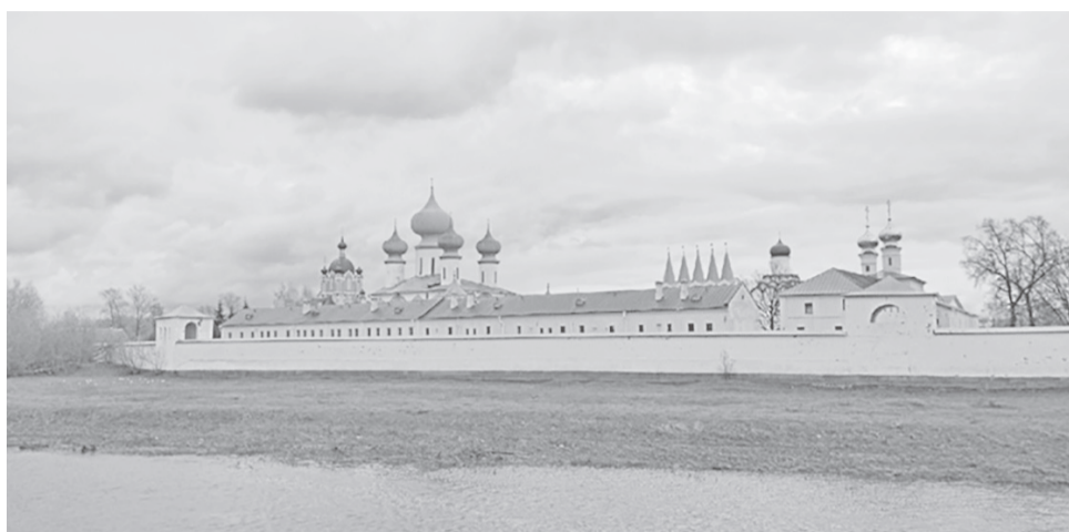
Тихвинский Богородичный Успенский монастырь. Вид с реки Тихвинки

20 июня 2004 года икона покинула Чикаго: была доставлена в Ригу, а потом – в Москву, и затем вернулась в родной монастырь. Событие радостное и значительное для православных христиан. Богоматерь подала знак Своего