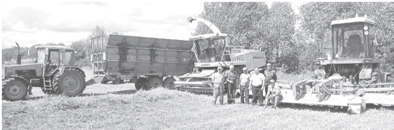
Кормозаготовительный отряд отделения «Левцово» ООО «Агромир»