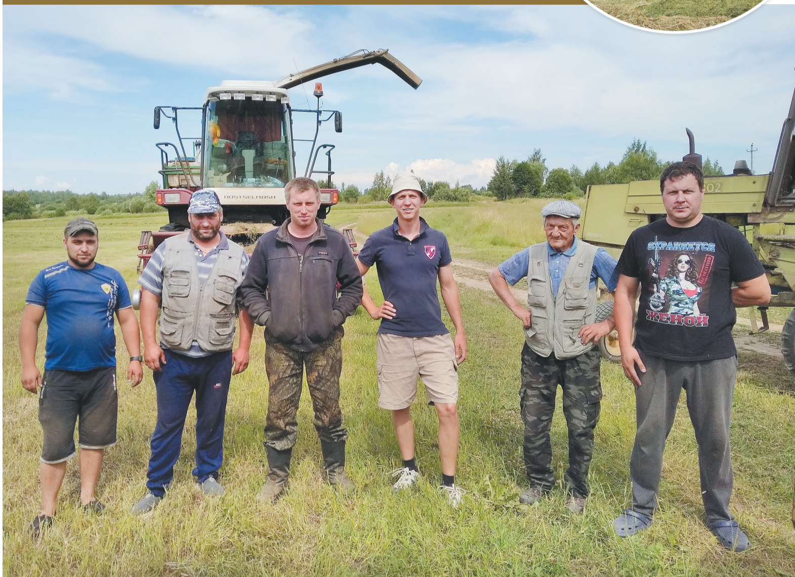
Дружный коллектив механизаторов ООО «СПК «Революция»