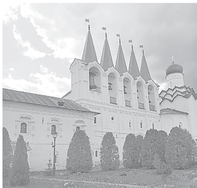
Колокольня Тихвинского монастыря

покровительства, особого попечения над Россией.