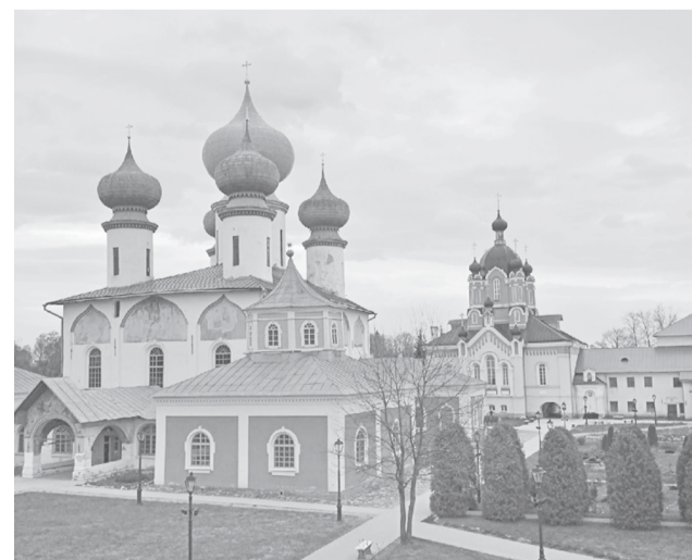
Успенский собор Тихвинского Богородичного монастыря

Во время паломничества посетили монастыри, храмы, познакомились с несколькими жителями Тихвина – священниками, экскурсоводами, таксистами, певчими... И все они говорили о том, что после возвращения Тихвинской иконы Божией Матери в родную обитель жизнь в городе изменилась к лучшему, он словно воспрял, расправил плечи. И верится, что со временем будут восстановлены все святыни славного северного Тихвина.