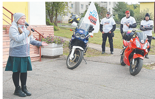
Детская песня на митинге перед стартом