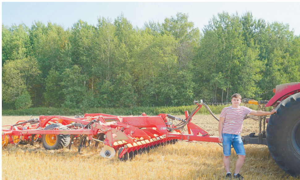
У полеводов горячая пора

на предприятии: современные экскаваторы, валкообразователь «Лайнер», силосоуборочный комбайн «Ягуар» фирмы «Клаас», передвижную плюшилку зерна, обмотчик рулонов и многие другие механизмы. Мы увидели, как работает в поле высокоэффективный универсальный культиватор TopDown, способный выполнять одновременно за один проход полную поверхностную и глубокую обработку почвы.