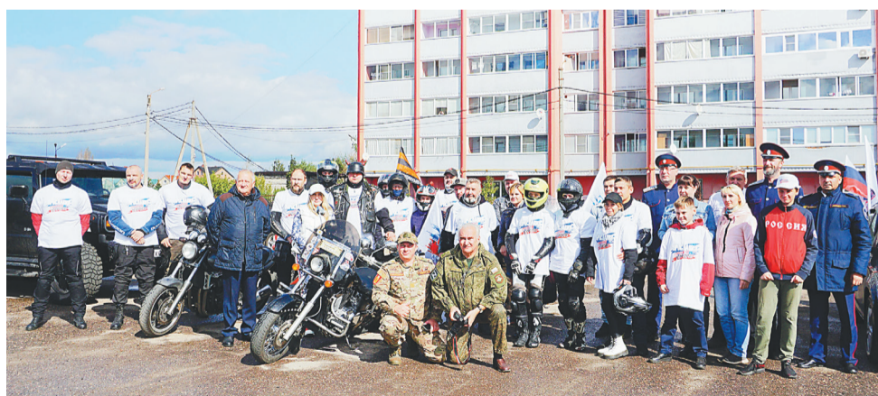
Участники автомотопробега – в поселке Ивняки

Спасибо всем участникам за интересное и полезное мероприятие!