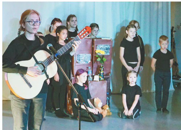
Тематическая постановка театральной студии

На митинге памяти прозвучала детская песня, проникновенные слова которой «Милые, добрые взрослые, отмените войну!» не оставили равнодушными никого из тех, кто собрался на стартовой