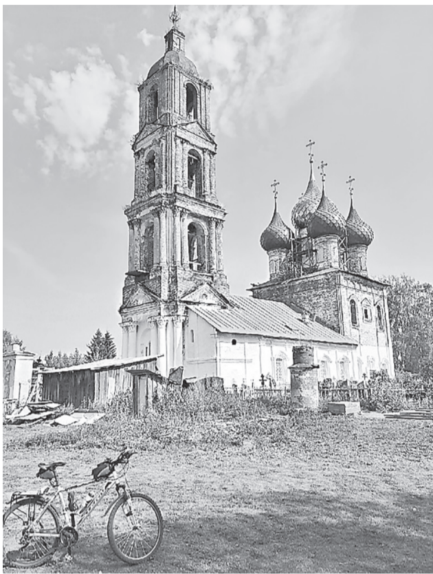
Спасский храм в Рыбницах