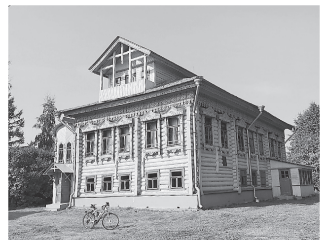
Дом-музей скульптора Александра Опекушина в Рыбницах

Деревянные ставни на окнах теперь большая редкость. В Ярославском районе сохранилось всего шесть таких домов.