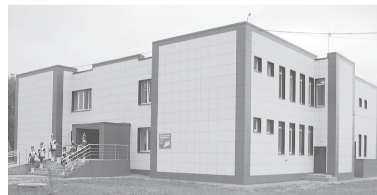
Здание дома культуры в Григорьевском

– Ежегодно в этом доме культуры проводится более 600 культурно-массовых и инфор-