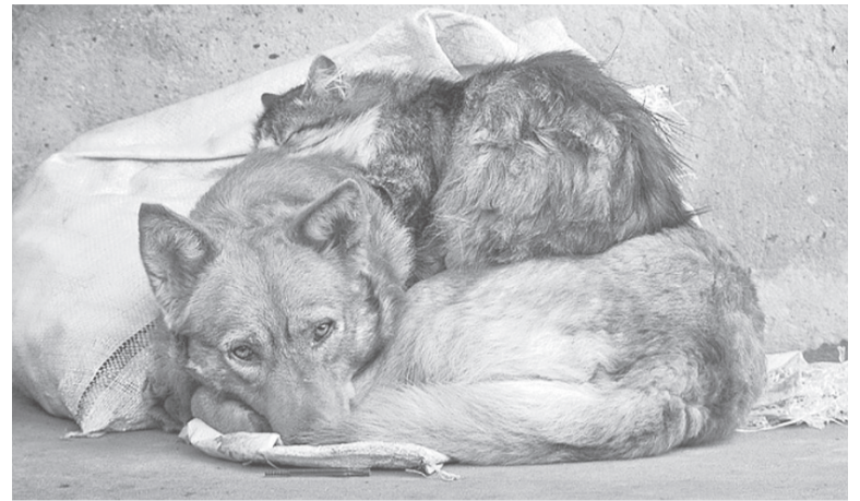
Из Федерального закона «Об ответственном обращении с животными и о внесении изменений в отдельные законодательные акты Российской Федерации» от 27.12.2018 № 498-ФЗ (последняя редакция)

Лица, которые преднамеренно скрывают безнадзорное животное, не являясь его хозяевами, могут быть привлечены по статье 19.1 КоАП РФ – самоуправство, то есть самовольное, вопреки установленному федеральным законом или иным нормативным правовым актом порядку осуществление своего действительного или предполагаемого права.