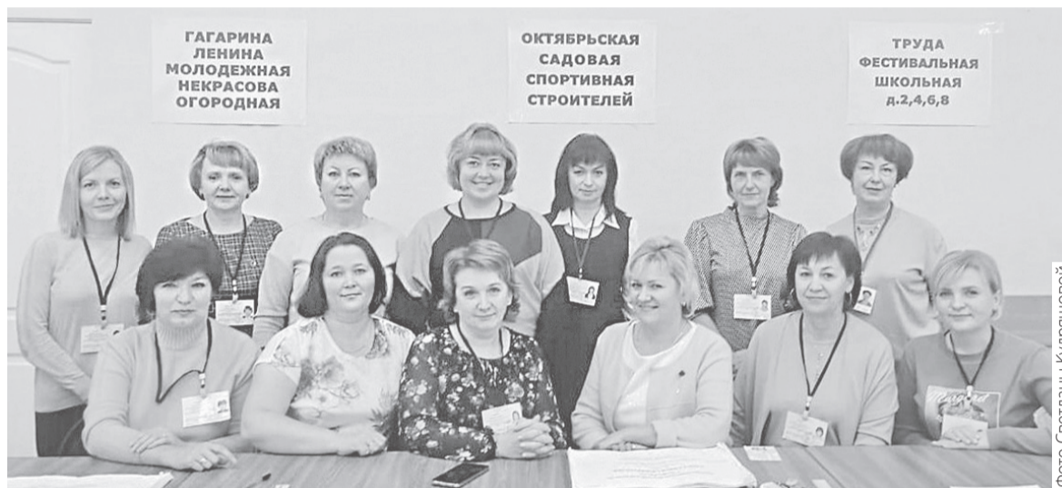
Комиссии на избирательных участках № 2313 в поселке Дубки (фото сверху) и № 2312 в поселке Красные Ткачи (фото внизу) работали слаженно

– У меня не было никаких сомнений – идти ли на выборы? Конечно, да, необходимо отдать свой голос за губернатора. Это очень важное событие касается