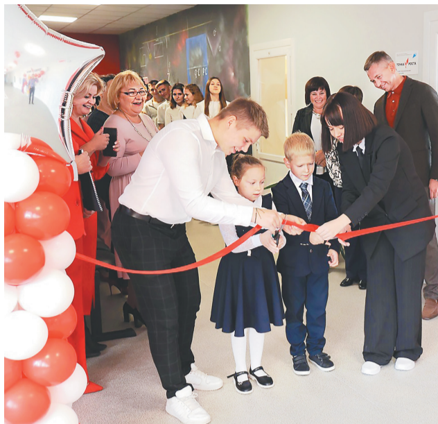
Открытие центра «Точка роста» в Туношенской школе

Также в центрах «Точка роста» планируется реализация не только общеобразовательных программ по предметам химия, биология и физика с обновленным содержанием и материально-технической базой, но и программ дополнительного образова-