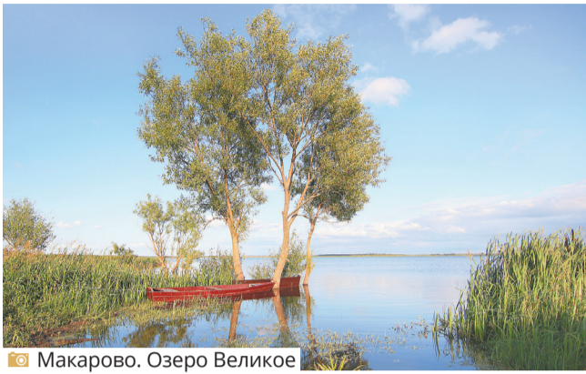
Макарово. Озеро Великое