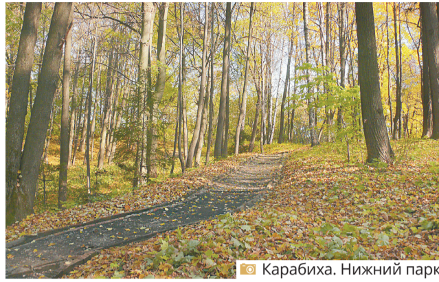
Карабиха. Нижний парк