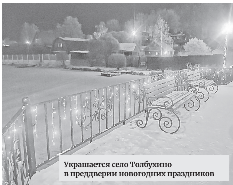
Украшается село Толбухино в преддверии новогодних праздников

В сборник включены фотографии писем солдатам, которые были отправлены учениками и педагогами. Письма ветераны РОС ВБД «Брат» передали нашим солдатам.