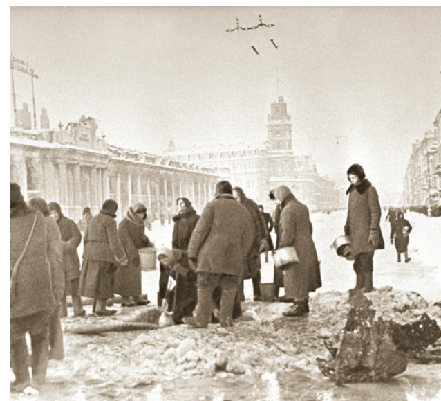
В блокадном Ленинграде