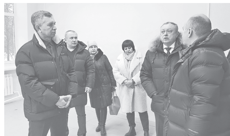
В новом здании амбулатории поселка Дубки

– В Григорьевском КСЦ с 1 марта будет функционировать новое молодежное пространство, которое должно стать доступным с 16 до 21 часа. Главное, правильно его наполнить, – отметил глава района. – Уверен, что хорошая идея придется по душе григорьевской молодежи.