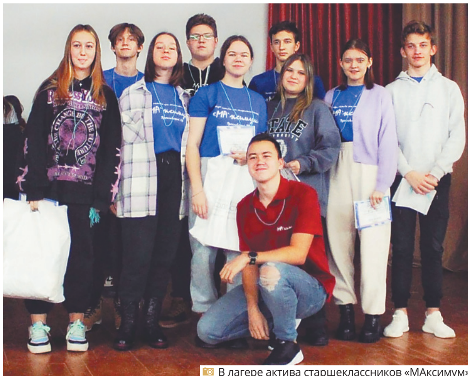
В лагере актива старшеклассников «МАКСИМУМ»