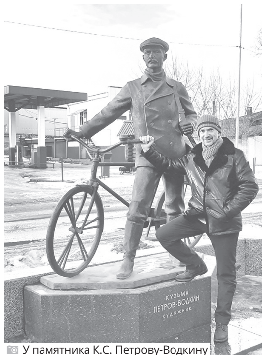
У памятника К.С. Петрову-Водкину