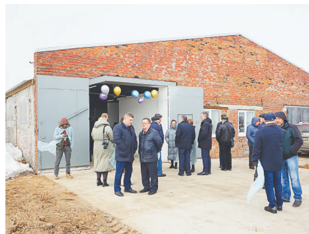
Животноводческий объект реконструирован