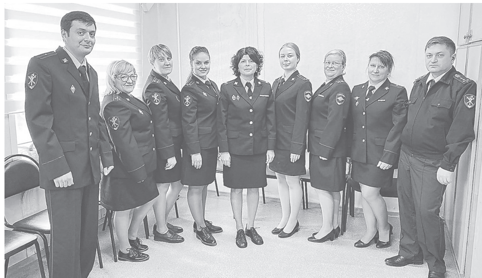
Личный состав следственного отдела ОМВД России по Ярославскому району

– Ветеранам – крепкого здоровья и благополучия! Что касается действующих коллег, хотелось бы пожелать им того же, а также стойкости и выдержки!