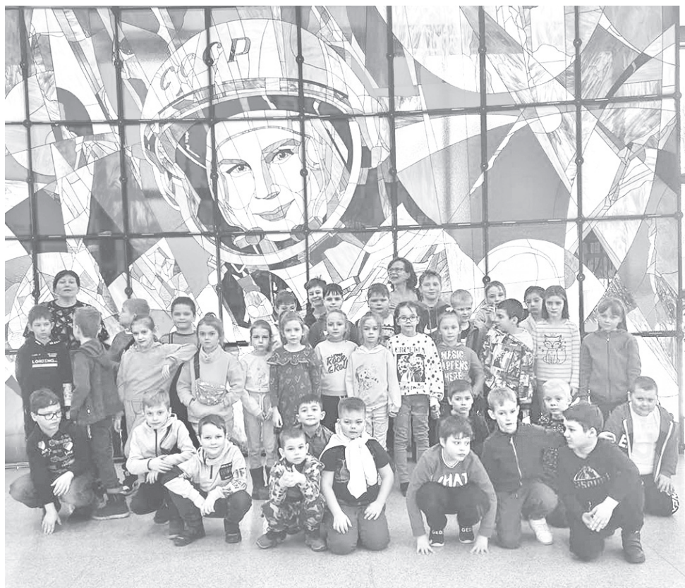
📷 В Ярославском планетарии