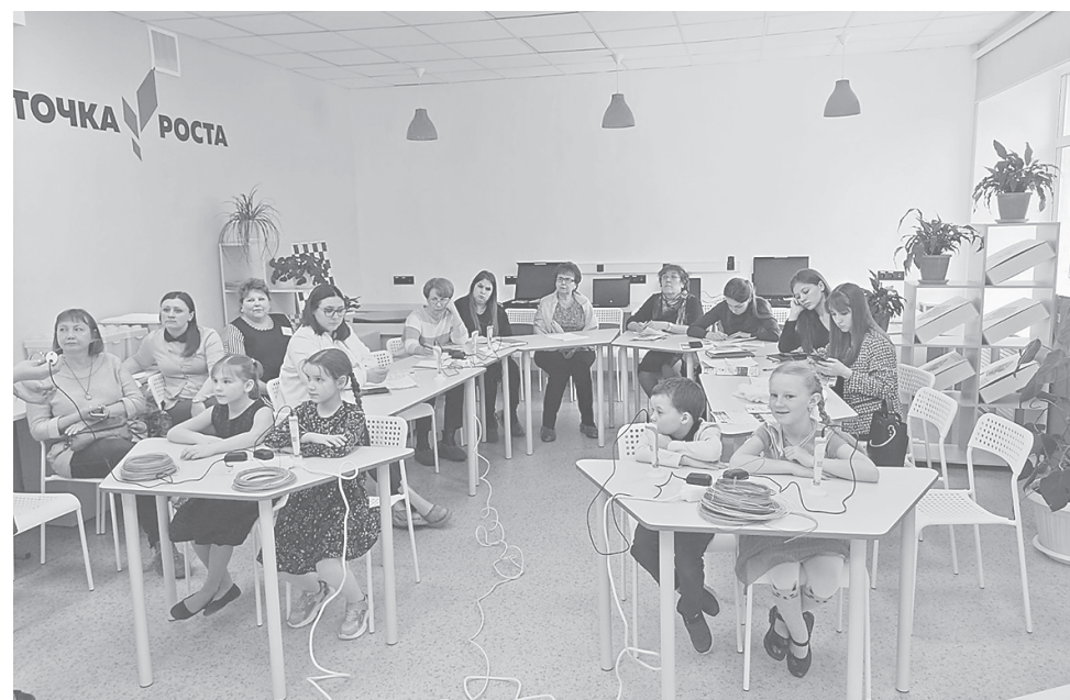
Все возрасты покорны знаниям

В завершение встречи состоялся круглый стол для обсуждения выступлений, где организаторы и участники получили ответы на интересующие их вопросы.