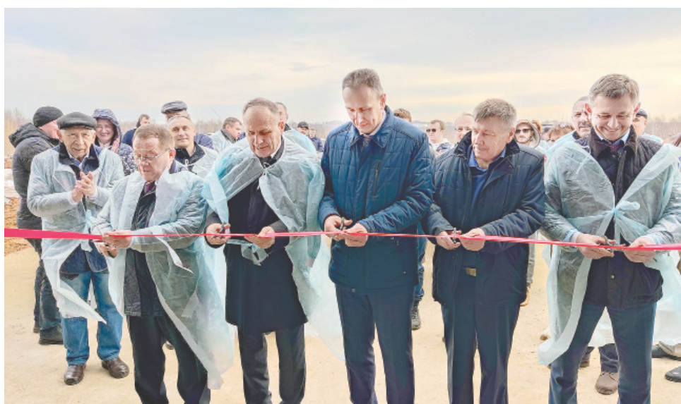
Торжественное открытие фермы

«Революция» работает с Ярославским научно-исследовательским институтом животноводства и кормопроизводства по сохранению вика Ярославской и клевера Конищевского. Здесь применяют гума-