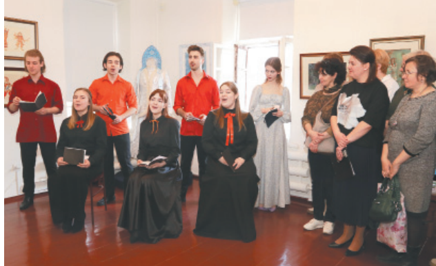
На открытии выступили студенты 1 курса театрального института