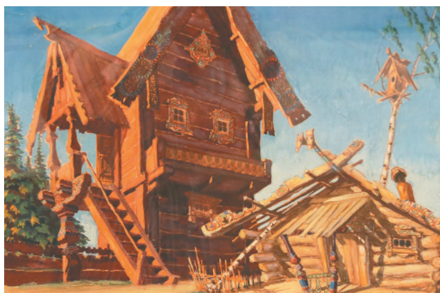
Эскиз декорации «Берендеева слобода» к спектаклю «Снегурочка». Автор – Владимир Талалай. 1943 год

овраги неподалеку от усадьбы и села Никола-Бережки. Это и легло в основу будущей пьесы. Творчество автора подпитывали интерес к прошлому, фольклор, родная природа. Многие давали драматургу поездки в любимую усадьбу, где он наблюдал крестьянский быт, ко-