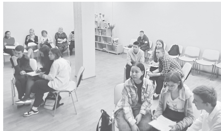
Финал конкурса школьных музеев

Организаторы благодарят руководителей школьных музеев за сохранение и популяризацию исторического и культурного наследия Ярославского края, воспитание патриотизма у подрастающего поколения!