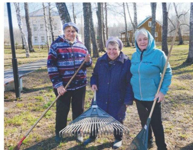
☉ Старосты села Толбухино