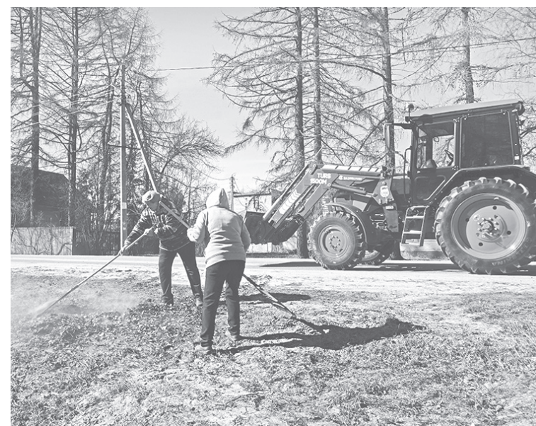
Кипит работа в Толбухино