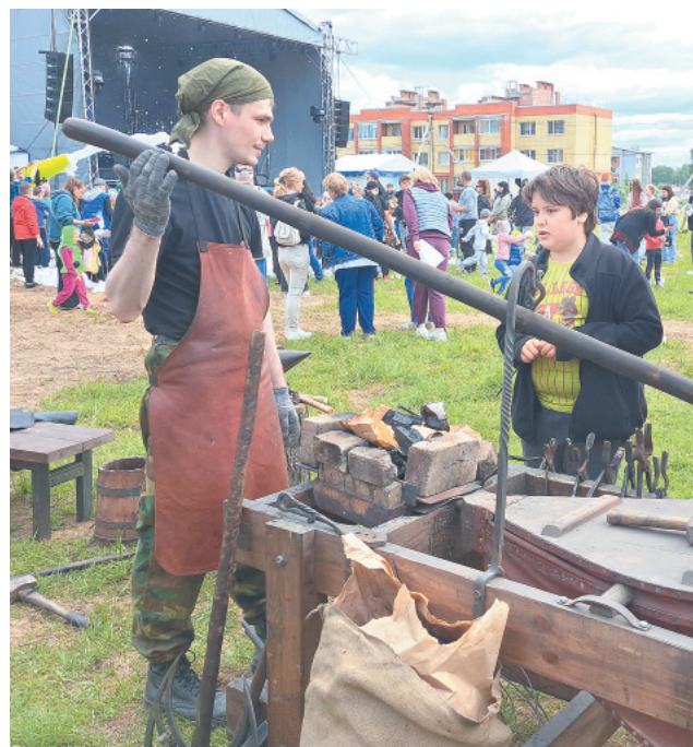
Кузница «Ярый молот»

им, много производим сельскохозяйственной продукции, много занимаемся спортом. У нас крепкий, перспективный, красивый район. Из года в год мы ремонтируем дворы, приводим в порядок дороги. Много сделано, но еще больше предстоит сделать всем вместе. Я сердечно поздравляю вас с днем рождения района, желаю хоро-