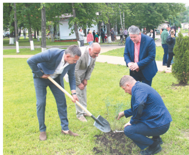
Закладка Аллеи Памяти