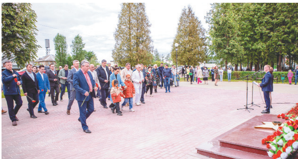
Возложение цветов к мемориалу воинам-землякам