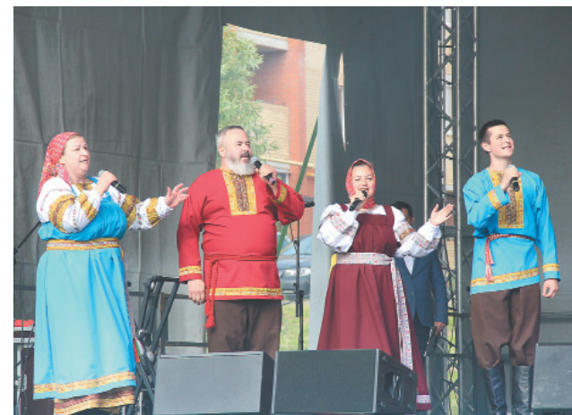
Таланты Ярославского района