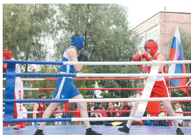
Поединок на ринге