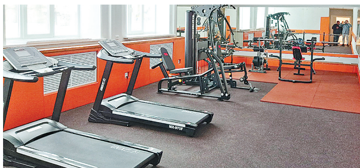
В Щедрино откроется спортзал

таются на коньках и стар и млад. Четыре осветительные мачты, установленные по периметру ледовой площадки, и видеонаблюдение позволяют это делать до позднего вечера. Чистят корт от снега, следят за качеством льда сами местные жители. Скоро за внебюджетные средства будет построена большая модульная раздевалка, к которой запланировано провести и канализацию, и водопровод. Планируется установка скамеек для запасных игроков с навесом, а чтобы любители коньков не скушали, корт оборудуют акустической системой. На всей территории этого спортивного объекта предоставляется бесплатный Wi-Fi. Летом это отличная площадка