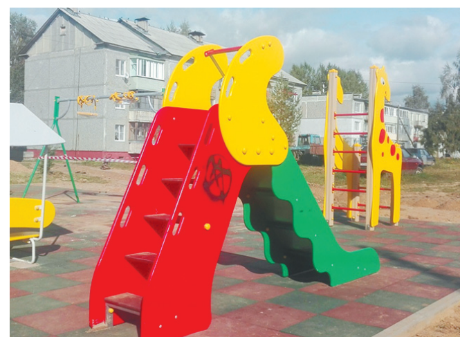
3, 4 Благоустройство дворов многоквартирных домов в д. Мокеевское

Более 14 млн человек проголосовали в 2023 году за проекты благоустройства на портале za.gorodsreda.ru 4 .