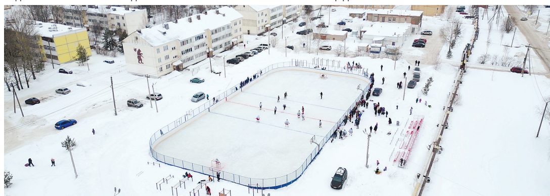
Ледовая площадка в п. Щедрино

Наш земляк награжден международным орденом «Крылатый лев», спортивным орденом «Золотой гиревик» и орденом «Звезда Героя», знаком «Отличник физкультуры и спорта» Федерального агентства по физической культуре и спорту, дипломами и почетными грамотами.