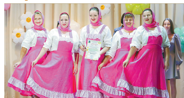
Танцевальный коллектив «Девчата» (Карабихский ЦКМС)

Так называется фестиваль-конкурс, плавно перетекающий во все любимый День деревни Ананьино. Он по праву является одним из ярких событий культурной жизни Ярославского района.