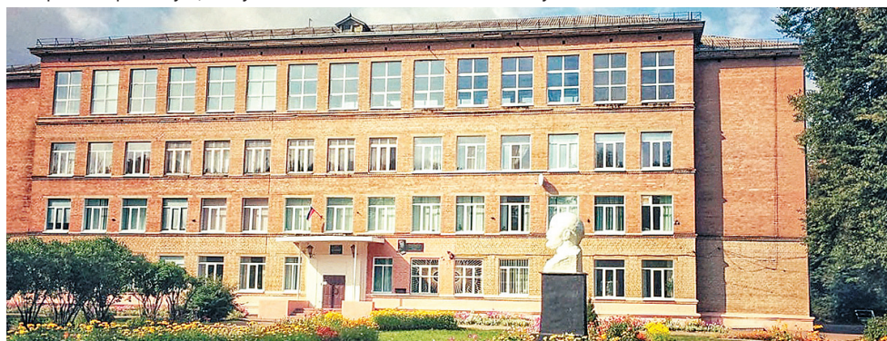
Здание Красноткацкой школы

Здесь обучается 1 182 человека по шести направлениям: физкультурно-спортивной, художественной, социально-педагогической, технической, туристско-краеведческой и естественнонаучной. На базе «Шанса» функционируют службы методического сопровождения и сопровождения опекунов (попечителей) несовершеннолетних. ЦДТ «Шанс» не раз признавался лучшим учреждением дополнительного образования ЯМР. Особое внимание коллектив уделяет благоустройству территории, реализуя ландшафтный проект совместно с Государственной академией промышленного менеджмента им. Н.П. Пастухова.