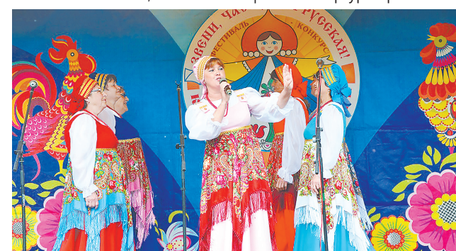
Исполнители частушек на сцене