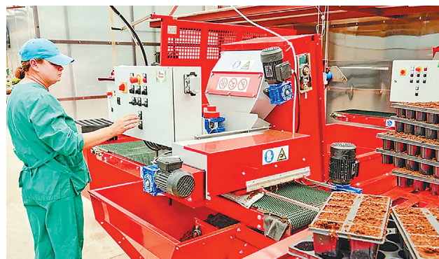
● Посевная линия в ТК «Лазаревское»

● Сегодня в поселении работает ООО «ТК «Ярославский», которое занимается круглогодичным выращиванием и реализацией овощей в защищенном грунте и входит в группу компаний «Горкунов». Предприятие входит в Ассоциацию «Теплицы России». Его продукция идет в Ярославскую область и соседние регионы.