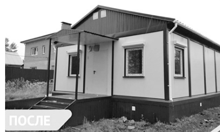
ФАП в деревне Дорожаево до и после реконструкции