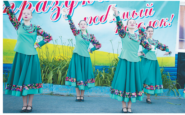
Танцевальный коллектив «Феерия» ЦДТ «Шанс»

● Детский сад № 8 «Ленок» в поселке Красные Ткачи ведет свою историю с 1969 г. Здесь проходят «Праздник первого сентября», «Масленица», «Зарница», театрализованные представления... Несколькими лет «Ленок» является