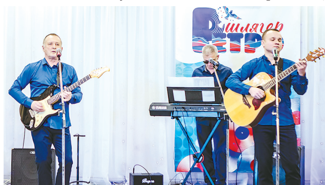
📷 Ансамбль «Волжане»