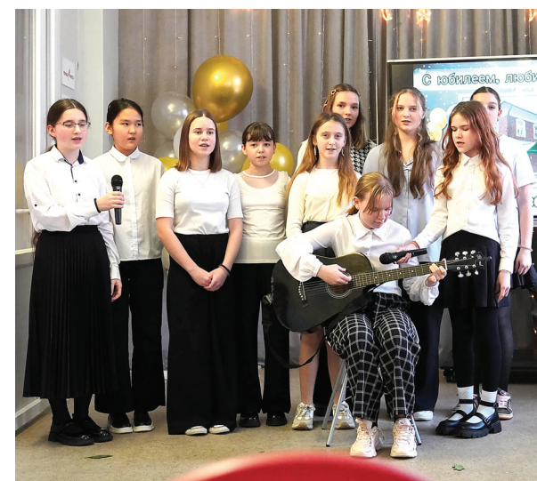
📷 Карабихской школе – 130 лет. На юбилейной сцене