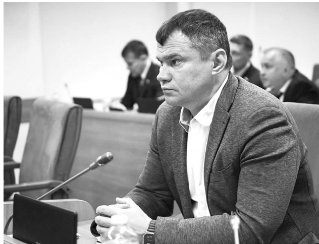
Предложения депутата услышаны

По госпрограмме «Местное самоуправление в Ярославской области» по инициативе и под депутатским контролем отремонтирована кровля ДК в Дубках. Обновлены входные группы в Дубковской, крыльцо и, при участии района, спортзал в Иванищевской школе, школьные забор и ворота в Красных Ткачах. Приведены в порядок пол в кабинетах начального образования Козьмодемьянской школы и веранды в детском саду «Родничок». В этом учреждении заменен линолеум в раздевалке группы младшего возраста, приобретено оборудование пищеблока. В детском саду «Ивушка» дооснащена система видеонаблюдения.