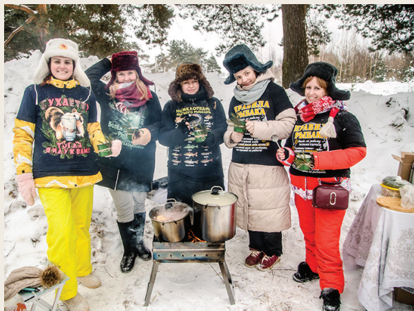
Праздник ярославского валенка