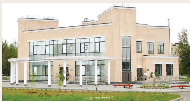
📷 Общественно-культурный центр в поселке Красный Бор