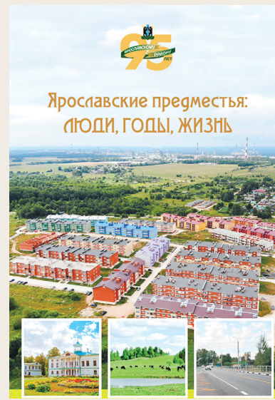
📷 Сборник «Ярославские предместья: люди, годы, жизнь» – победитель в номинации «Лучший издательский проект».