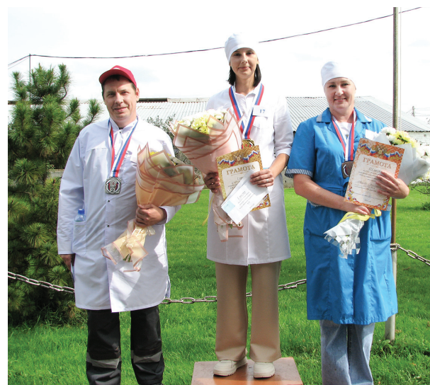
📷 Призеры областного конкурса операторов по искусственному осеменению крупного рогатого скота