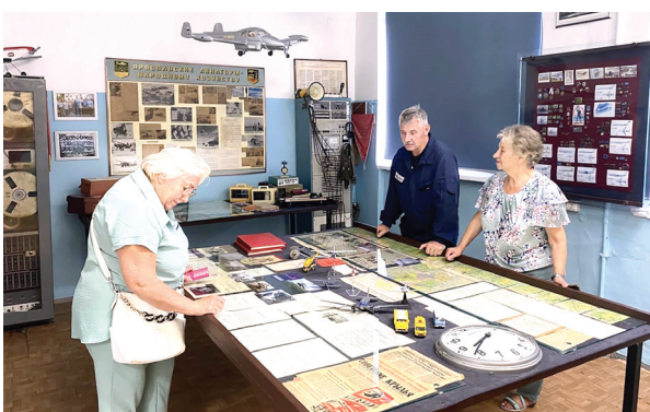
Музей авиации в АТК «Левцово»