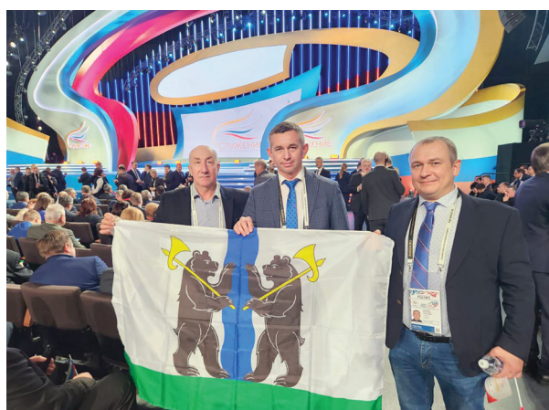
Делегация Ярославского района на форуме «Малая Родина – сила России»