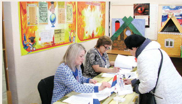
Избиратели Ярославского района приняли участие в выборах Президента России