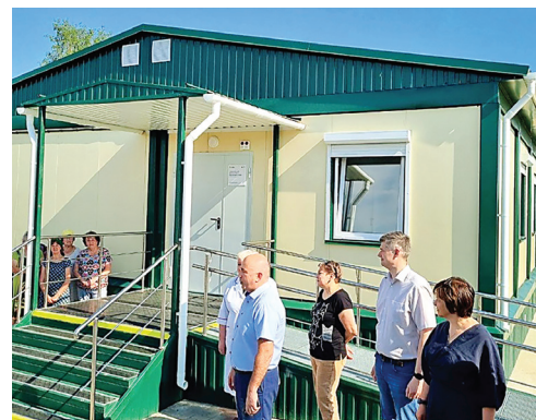
В селе Прусово открыли современный ФАП