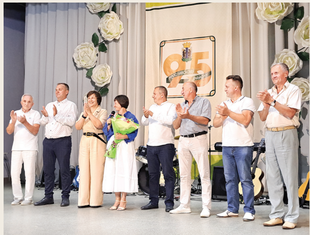
📷 Праздник, посвященный 90-летию Ярославского района