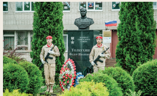
«Маршал-Парад» в селе Толбухино