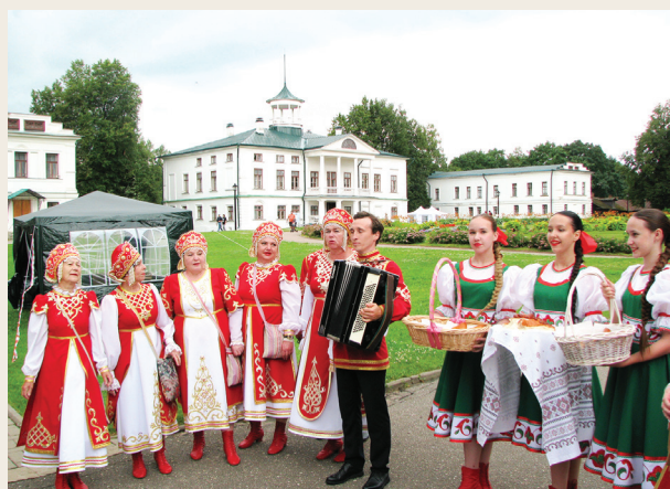
📷 Некрасовский праздник поэзии в Карабихе