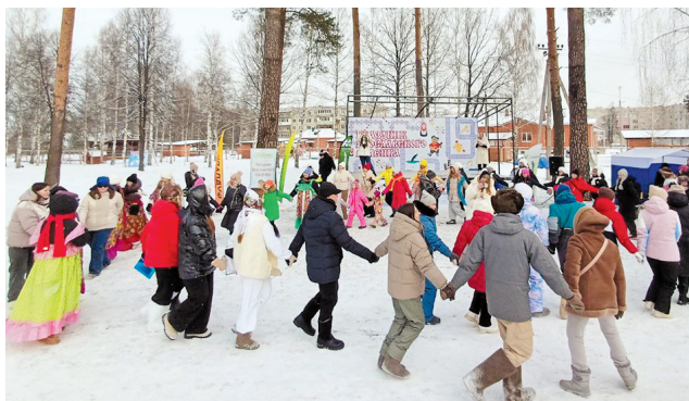
Закружили в праздничном хороводе

По общему мнению участников, гостей и организаторов праздник удался на славу и никого не оставил равнодушным.