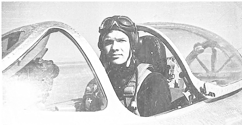
Летчик-инструктор в Харьковском училище

Трудно было и в первые послевоенные годы. Из-за неурожая все, что удалось вырастить, сдавали государству. И корову пришлось отдать. Еще затемно мама с отцом уходили косить траву. А мы, ребята, собирали сено и укладывали на двухколесную тележку. Впереди обычно ставили меня как рулевого, а остальные толкали сзади. Меня из-за сена почти не было видно, но управлял тележкой я умело. Работы хватало всем. Я обычно