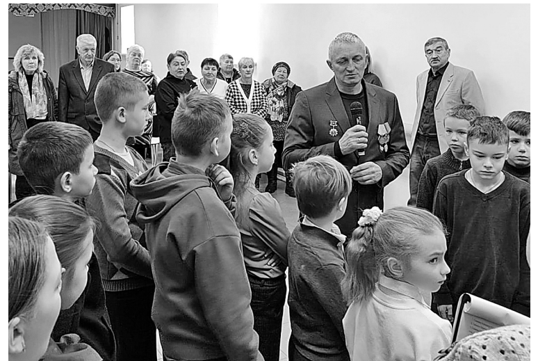
Участники встречи – с юными жителями п. Заволжье

ученики начальной школы поселка Заволжье. Ветераны рассказали о событиях афганской