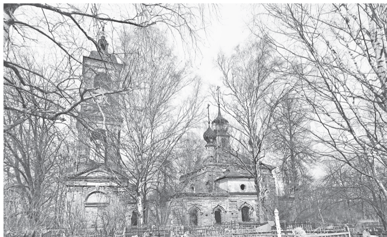
Крестовоздвиженская церковь на Селифонтовском кладбище

– Мы разрабатываем проект кладбища, которое будет размещаться рядом с Осташинским. Перейдем в Селифонтово, если только критически негде будет хоронить.