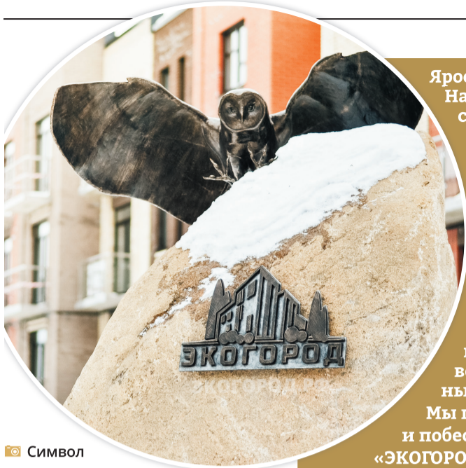
Символ жилого комплекса «ЭКОГОРОД» – сова

Ярославский район активно развивается. На его территории ежегодно строится более ста тысяч квадратных метров жилья, вводятся новые микрорайоны. В 2018 году планировалось ввести 75 тысяч квадратных метров жилья, а введено более 200 тысяч.