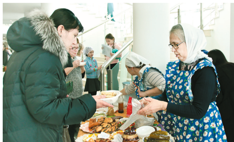
Прихожане храма Рождества Пресвятой Богородицы делятся секретами постной кухни

Уверена, что каждый, кто посетил удивительный праздник, не только узнал что-то новое о постной кухне, но и получил в дар теплое и душевное общение с замечательными светлыми людьми, мастерами своего дела. Фестиваль стал яркой и доброй страничкой Великого поста.