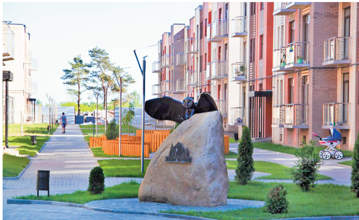
Красота и чистота в жилом квартале

– Да, действительно, мы хотим сплотить наших жителей, чтобы их жизнь стала яркой и насыщенной, создать для них некую территорию комфорта. Мы организуем различные конкурсы и праздники, вовлекаем их в общественную работу. Жители ЭКОГОРОДА участвуют в субботниках по очистке Яковлевского бора от мусора, мастерят скворечники для птиц, принимают участие в праздновании Масленицы, Нового года и т.д. Так, на Новый год мы