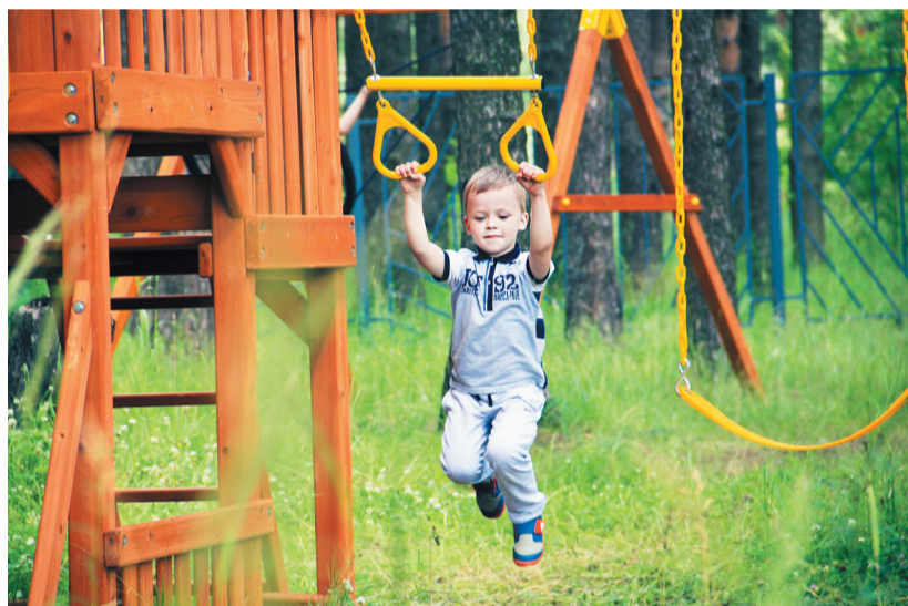
Спорту все возрасты покорны