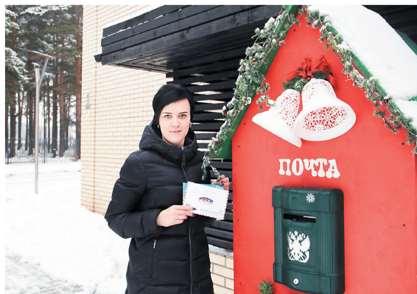
В ЭКОГОРОДЕ сбываются желания