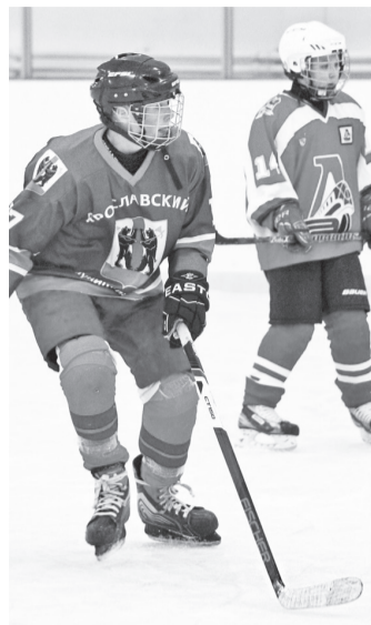
● Пресс-центр администрации ЯМР

На ледовой арене поселка Некрасовское впервые прошел матч звезд Ярославского района среди детей и взрослых.