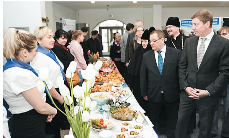
Почетные гости фестиваля знакомятся с выставкой

– Фестиваль имеет большое значение, ведь он позволяет людям научиться правильно готовить постную пищу. Здесь можно увидеть, что она может быть красивой, эстетичной, вкусной и, главное, полезной. Мы учимся друг у друга, обмениваемся рецептами, делимся секретами приготовления, и затем используем полученные знания на приходах, в семьях. Фестиваль позволяет нам общаться друг с другом. Кроме того, здесь можно купить хорошие книги, глиняную посуду, в которой самые простые блюда необычайно хороши. Радует, что много детей, они учатся, смотрят, как взрослые готовят постную пищу. Так передаются традиции.