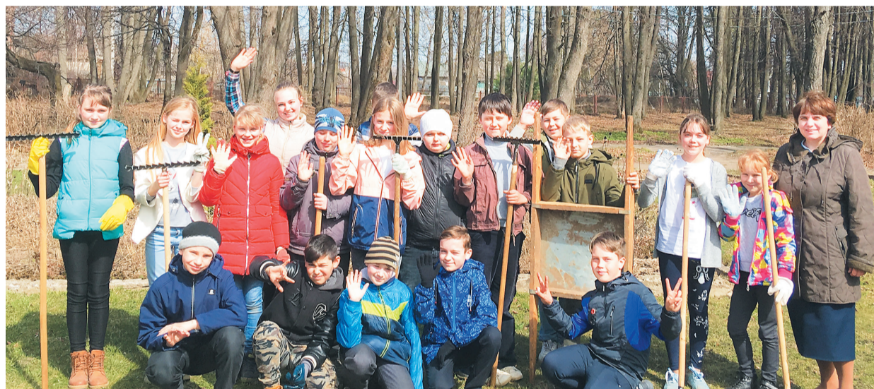
Учащиеся Красноткацкой школы на субботнике