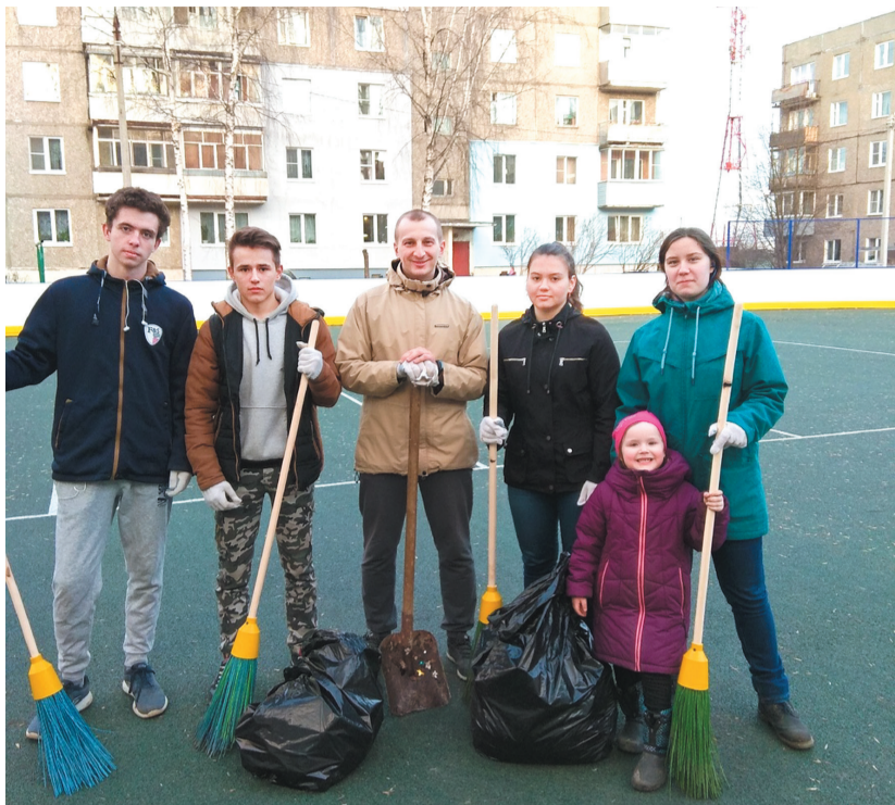
Работа завершена – территория убрана

Марафон субботников. Продолжение темы – на стр. 16