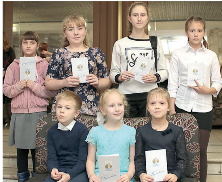
Юные призеры из Ярославского района

– Ребята, участвующих в литературном конкурсе «Вдохновение», отличают несомненный