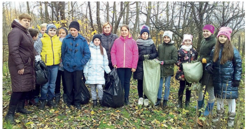
Акция в Лучинской школе