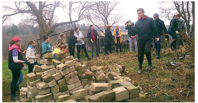
Субботник у Покровского храма в селе Ширинье