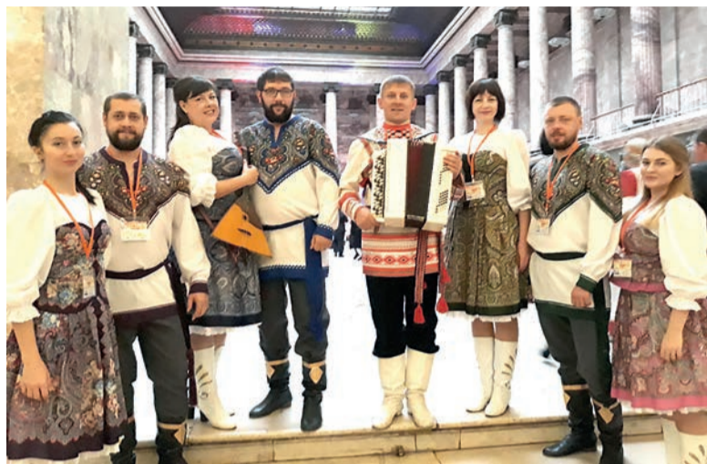
Ансамбль «Добройр» в Санкт-Петербурге

Народный вокальный ансамбль «Добройр» Леснополянского культурно-спортивного центра стал лауреатом Международного фестиваля «Добровидение», который проходил 9-10 октября в Санкт-Петербурге. Из 90 коллективов, принимавших участие в фестивале, 16 стали лауреатами, в том числе ансамбль из Ярославского района.