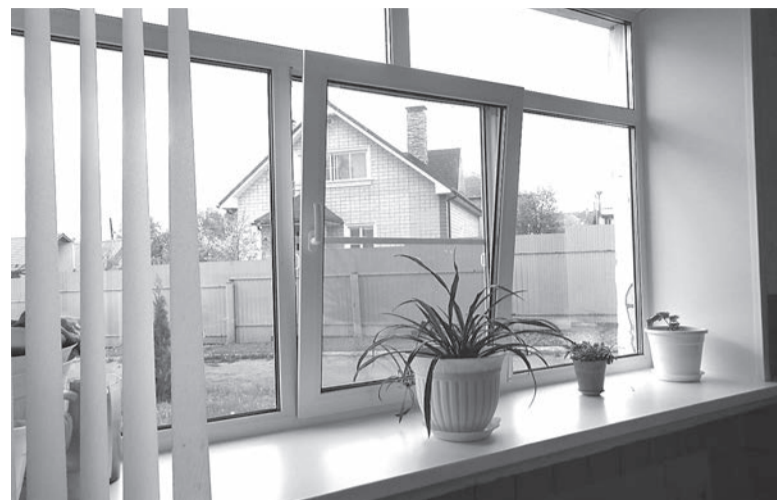
Новые пластиковые окна в начальной школе поселка Заволжье

В 2018 году в проект «Решаем вместе!» включен поселок Красный Бор, где были благоустроены дворовые территории у двух домов: сделано асфальтовое покрытие, установлены