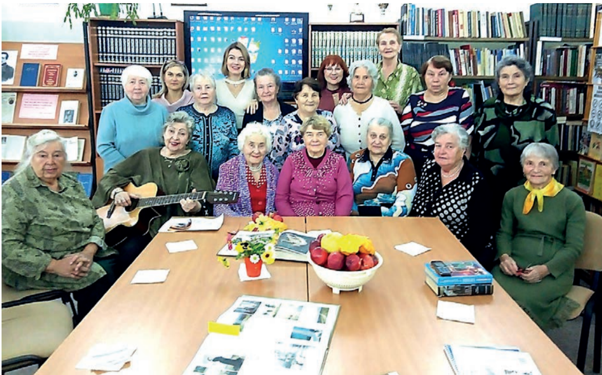
Новоселье в библиотеке поселка Михайловский