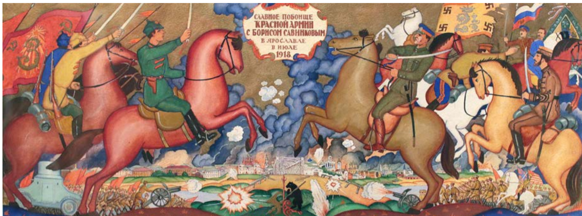
Славное побоище Красной армии с Б.Савинковым в Ярославле в июле 1918 года. 1926 год