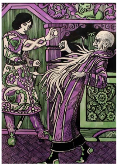
Иллюстрация к сказке «Кощей бессмертный». 1915 год

Сотрудники музея-заповедника «Карабиhi» стали почетными гостями в художественном музее в день открытия выставки.