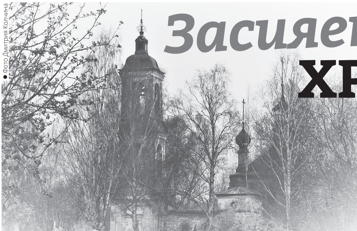
• Фото Дмитрия Колчина