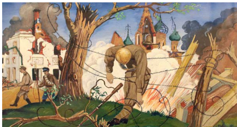
Белогвардейский мятеж. 1929 год