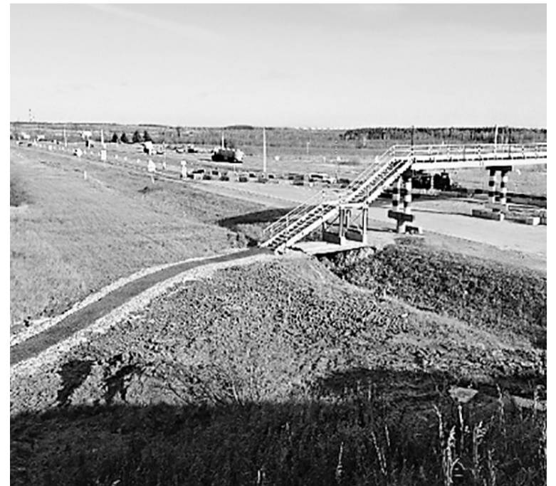
Участок трассы обустроен

В летний период 2020 года будет выполнен ремонт дороги Карабиха – Введенье от деревни Шепелево до села Введенье.