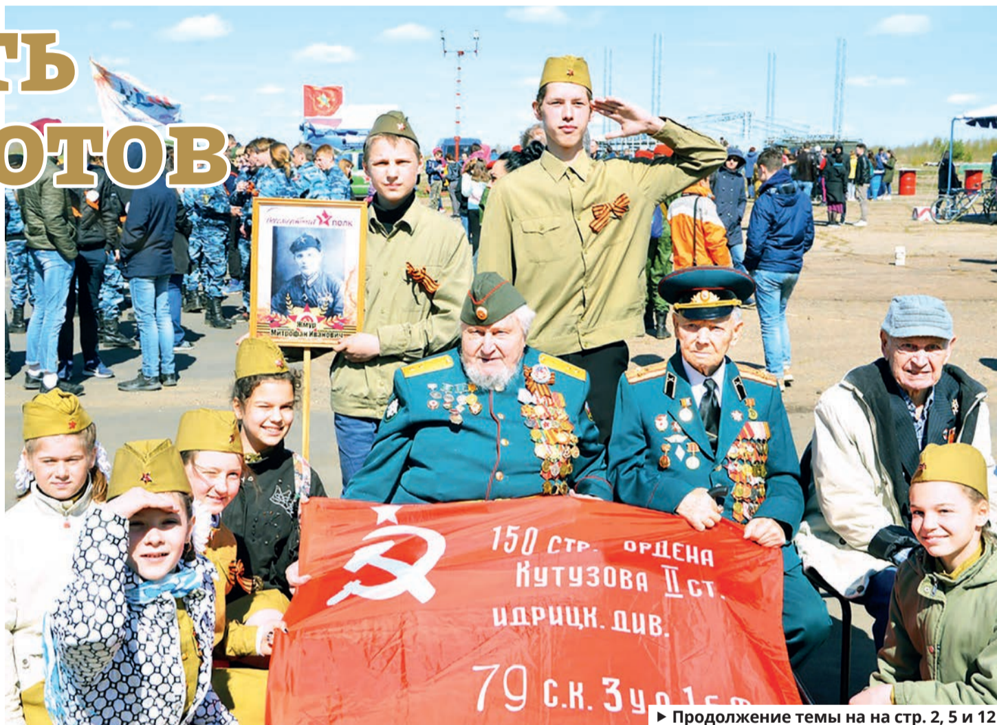
Знамя Победы – один из символов единения поколений

– Это комплекс добрых дел во благо своего поселка, района, страны.