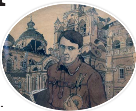
Автопортрет на фоне зданий Спасского монастыря. 1921 год

В Ярославском художественном музее вспоминали 17 октября художника и первого хранителя ярославской художественной галереи Александра Малыгина. Были показаны его картины, часть из них представил музей-заповедник Н.А. Некрасова «Карабиhi».