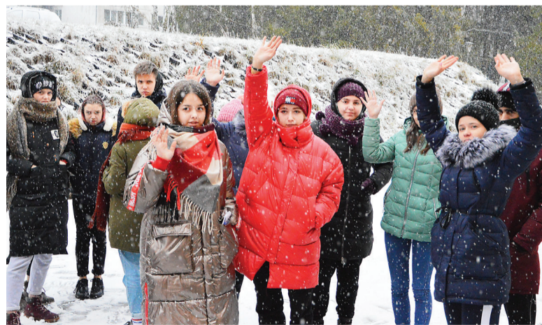
До свидания, «Сахарож»! Мы снова встретимся!

– Три дня и две ночи пролетели как миг. Спасибо организаторам за максимум душевности,