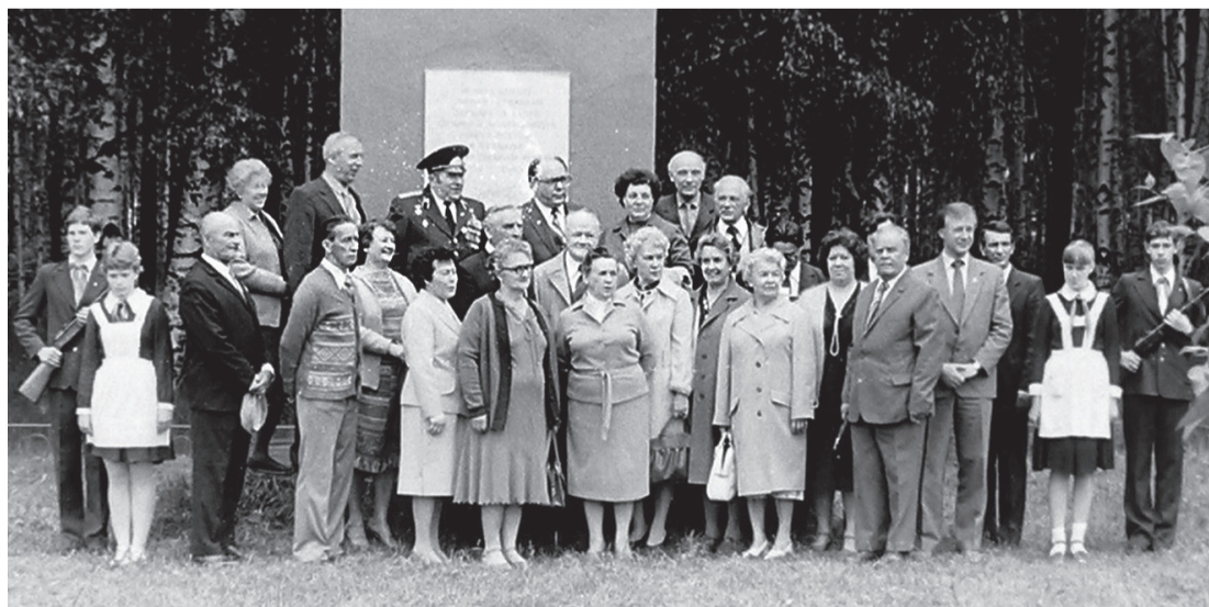
Выпускники 1941 года Красноткацкой средней школы. Встреча 1985 года