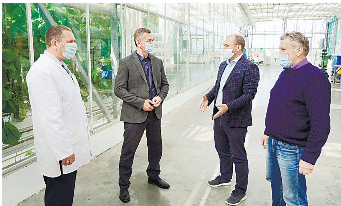
☞ Деловая встреча в ООО «Тепличный комбинат «Ярославский»

В настоящее время площадь теплиц здесь составляет 16,8 га. На большей части (69 процентов) выращивают огурцы, также есть томаты (20 процен-