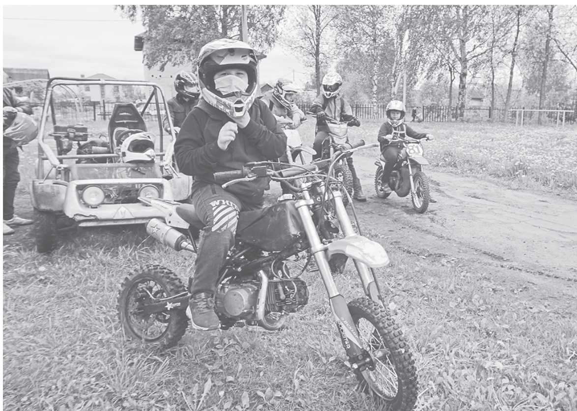
Ключ – на старт и вперед – к победе