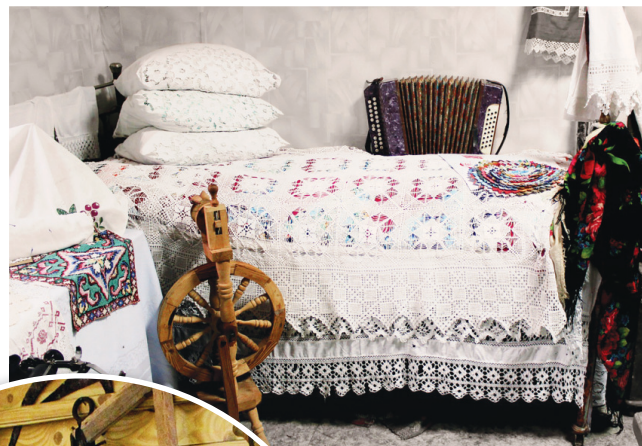
☞ Музей «Русская изба»

архитектуры – главного дома усадьбы Полозовых. Здание в плачевном состоянии, заходить внутрь опасно. Но даже сейчас видно, как красив был дом – с закругленными стенами фасадов, утонченными проемами окон. Говорят, здесь бывал в гостях сам Николай Алексеевич Некрасов, любивший охотиться в этих местах. А хозяин усадьбы – прототип одного из персонажей поэмы «Кому на Руси жить хорошо». Одно время в главном доме была Спасо-Шубинская школа, где детей учили агрономии и ветеринарии. Затем она стала сельскохозяйственным техникумом. До 1986 года в этом здании находились клуб, контора, на первом этаже – жилые комнаты. В 1986-1987 годах всех из дома выселили. В начале 1994 года рухнула крыша дома. Оно на долгие годы осталось бесхозным. Разрушалось у всех на глазах. Но фундамент довольно прочный, это подтвердила специализированная экспертиза, проводившаяся в девяностые годы