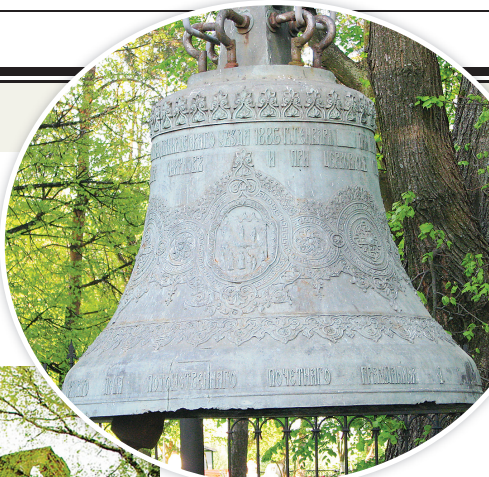
☞ Колокол Сысой из Шахова