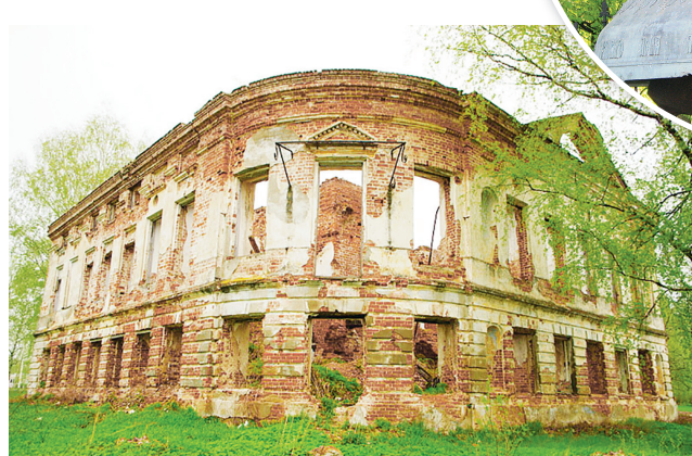
☞ Главный дом усадьбы Полозовых