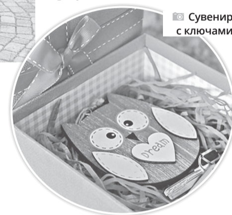
Сувенир с ключами

кеты без добавления свинца. Панорамные окна обеспечивают большое количество света, обогащая внутреннее пространство красивыми видами. Индивидуальные газовые котлы в каждой квартире позволяют существенно экономить на коммунальных платежах. Квартиры сдаются с предчистовой отделкой, что позволяет владельцам обустраивать жилье по своему вкусу. Фасады необычны – выполнены в стиле современной голландской архитектуры. Малая этажность зданий создает камерную обстановку, добавляя уюта благоустроенным дворам. Красивая, ухоженная территория, ландшафтный дизайн, развивающие детские и спортивные площадки – все это требует постоянного внимания,