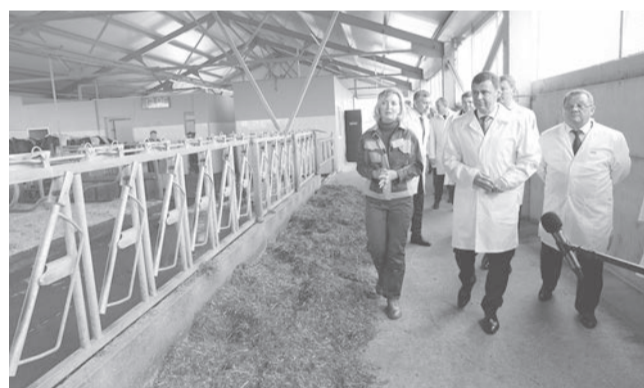
Визит руководителя области на сельхозпредприятия Ярославского района

Одним из приоритетных направлений деятельности правительства Ярославской области является развитие строительной отрасли. По итогам 2019 года общая площадь введенного жилья на территории региона составила 777,7 тыс. кв. м, что на 1,2 процента выше, чем годом ранее.