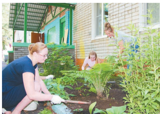
☞ Молодые педагоги облагораживают школьный двор

Практически все планы на сегодняшний день реализованы. С 3 августа у нас открыт детский лагерь. Будем с удовольствием отдыхать и работать, – подытожила