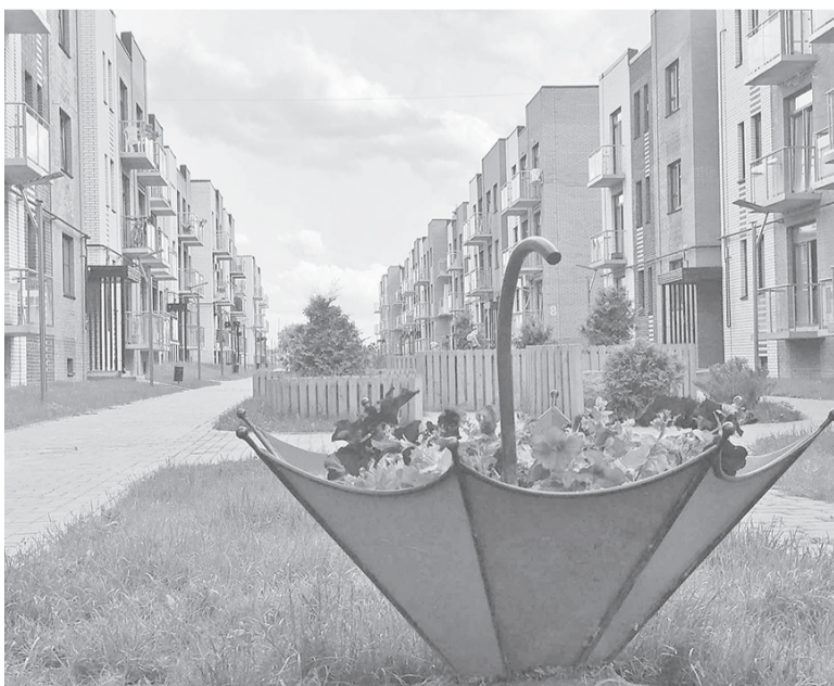
Цветы в «ЭКОГОРОДЕ»

Средняя стоимость строительства одного квадратного метра общей площади отдельно стоящих жилых домов квартирного типа, введенных в действие в январе-июне, составила 35 978 рублей (в г. Ярославле – 46 382 рубля).