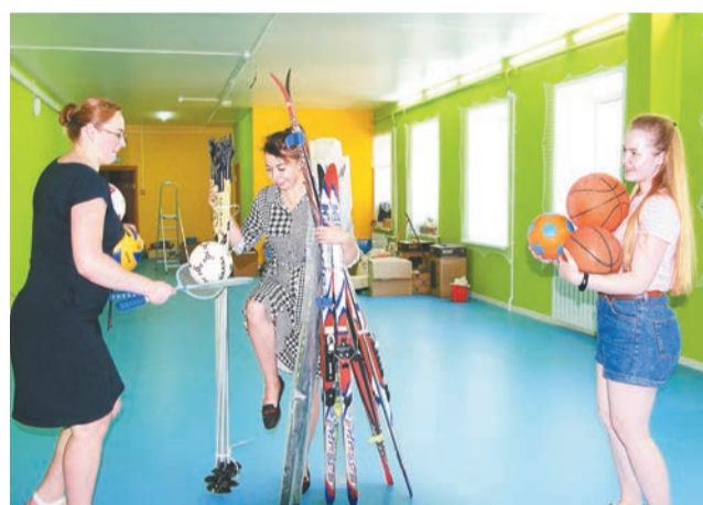
☞ В ожидании спортивных баталий