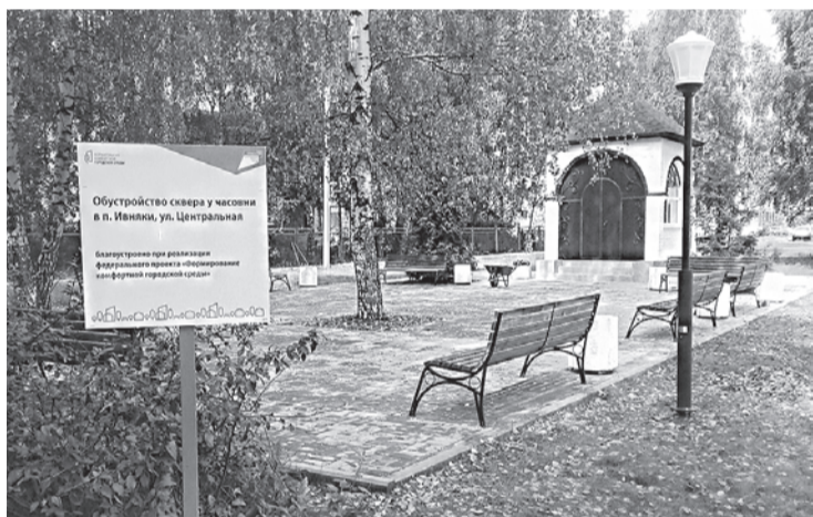
Обустройство сквера у часовни в поселке Ивняки

Работы по десяти адресам завершены. Среди них благоустройство дворовой территории возле домов 1, 2, 6, 7 в поселке Заволжье, установка спортивной площадки в поселке Красный Бор, обустройство сквера возле часовни