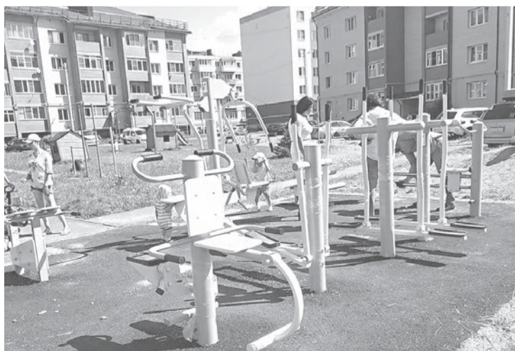
Спортивная и тренажерные площадки в поселке Красный Бор

В рамках поддержки местных инициатив завершено благоустройство территории возле памятника воинам в поселке Красные Ткачи, заканчиваются ремонты школ в Карабихе и Лесной Поляне. Уровень выполнения работ по этим объектам также около 90 процентов.