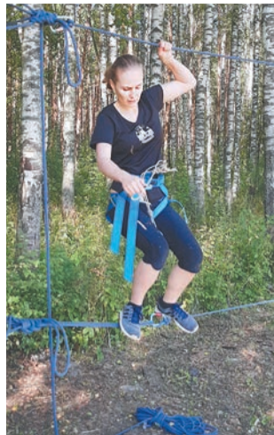
На туристической полосе

Надежно закрепив страховочные карабины, разновозрастные туристы преодолели этапы под названиями «Стена», «Кочки», «Бабочка», «Путанка», «Радиус», «Переправа», и параллельные веревочные прямые с петлями. Перед лабиринтом для московского ориентирования участники получили карты-схемы, чтобы под электронным контролем компьютера быстро и правильно отметить