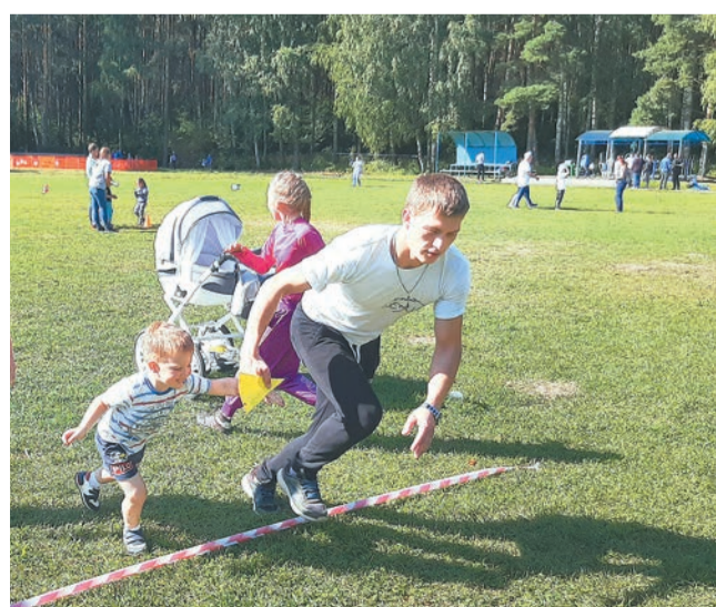
На старт! Внимание! Марш!

Все участники соревнования сфотографировались на фоне российского триколора, а организаторы вручили им сладкие призы — большие свежие арбузы. И все без исключения — дети и родители — остались довольны насыщенным субботним днем на стадионе в Лесной Поляне.