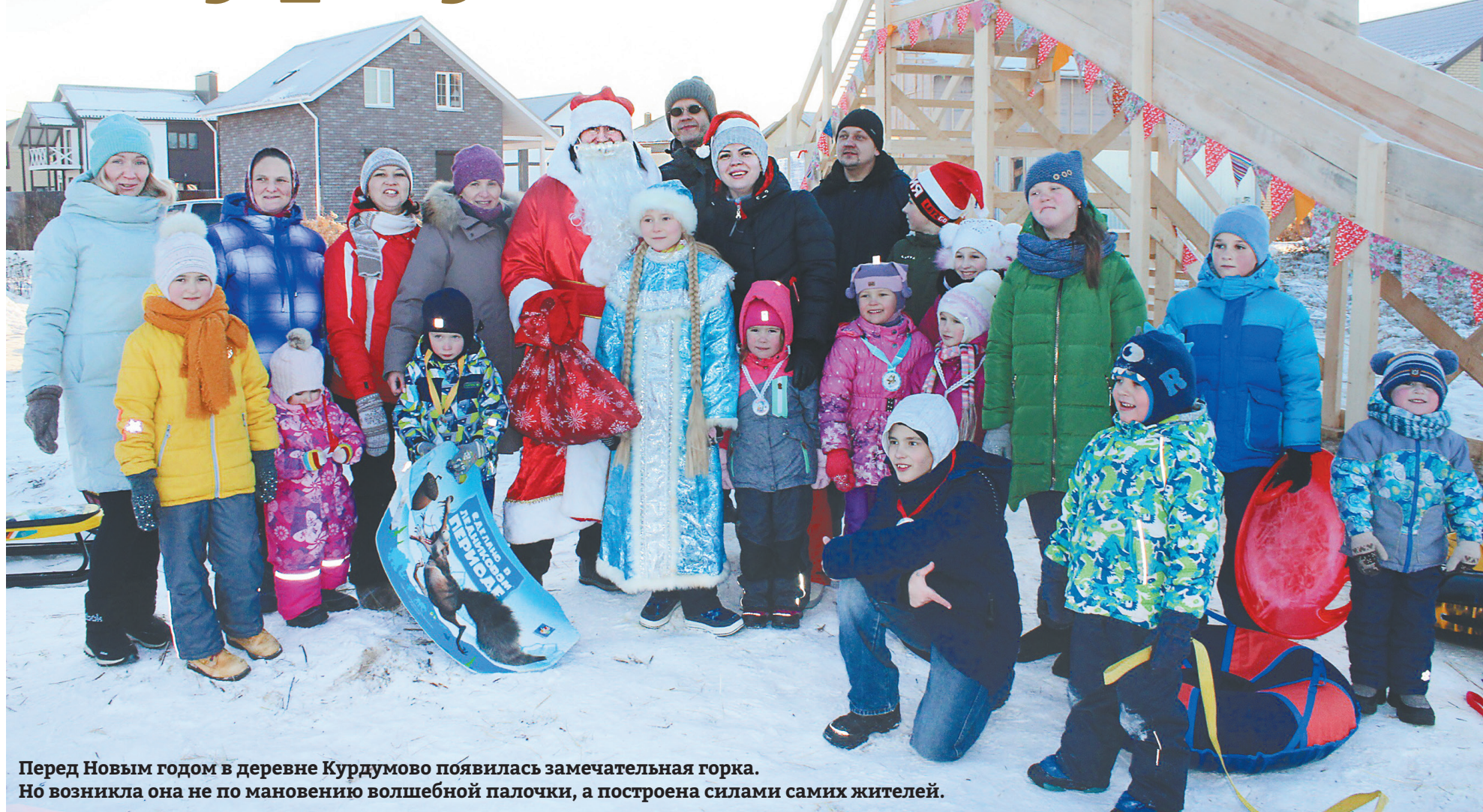
Перед Новым годом в деревне Курдумово появилась замечательная горка. Но возникла она не по мановению волшебной палочки, а построена силами самих жителей.