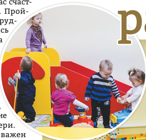
Интерьер новых яслей

Благодарность от имени главы Ярославского муниципального района Николая Золотникова