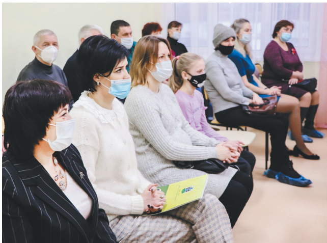
На церемонии открытия

– Не передать словами радости, которую мы испытываем! Открытие яслей – важное и долгожданное событие. Я хочу, чтобы наши дети шли сюда с радостью, а родители были спокойны за них.